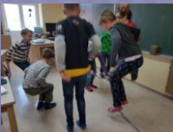
Gibanje med poukom