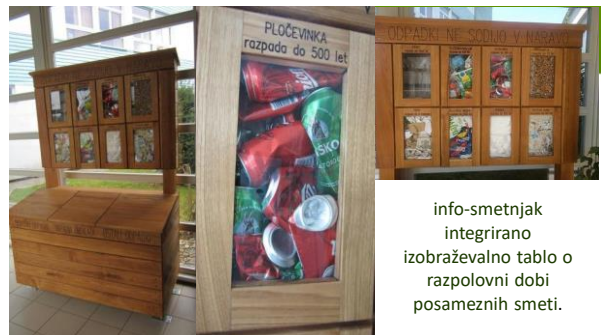
info-smetnjak integrirano izobraževalno tablo o razpolovni dobi posameznih smeti.