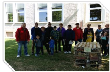
Eko tabor Trajnostna mobilnost Gibanje – hoja Urbani sprehodi