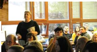
Osnovna šola Bršljin