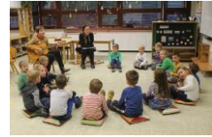
Osnovna šola Bršljin