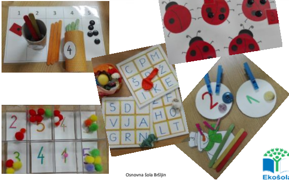
Osnovna šola Bršljin