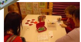
Osnovna šola Bršljin