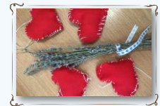
Srčki s sivko za boljši spanec