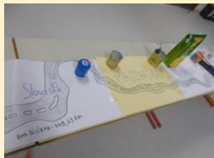
č. oblikovanje razstave v šolski avli