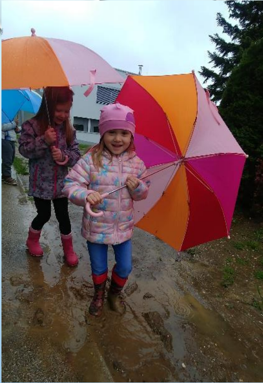
Po lužah čof čof ...