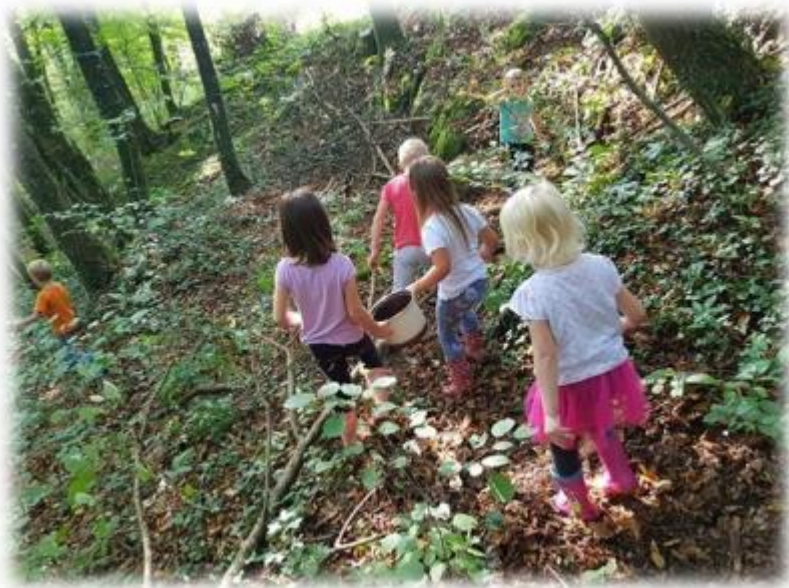
Kuhinja v gozdu.