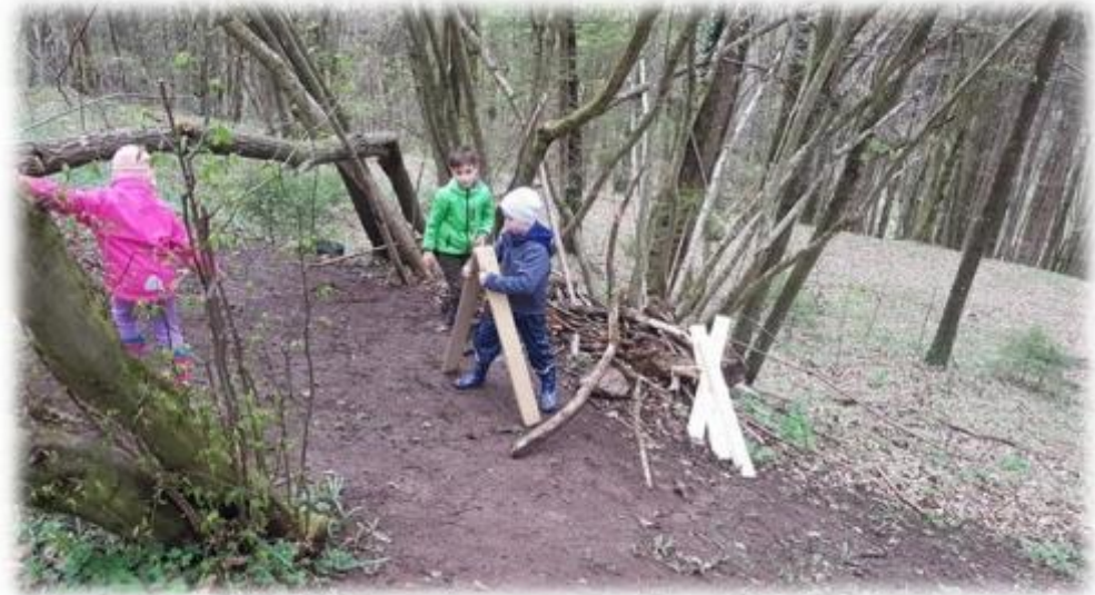
Hiša na drevesu.