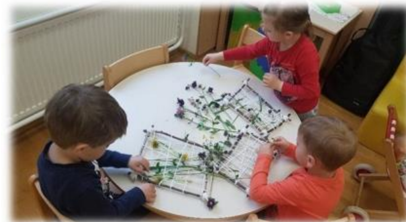
Prepletanje travniških rastlin.