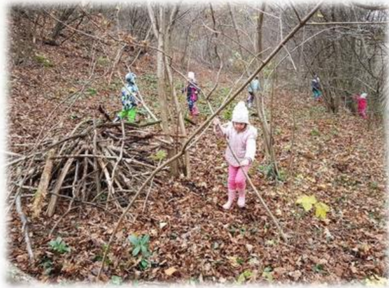
Hotel za žuželke.