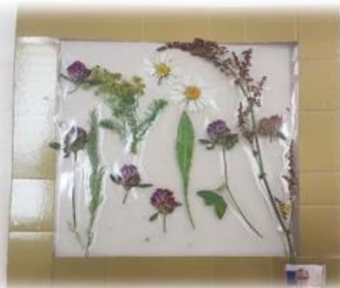
Slike iz travniških rastlin na samolepilni foliji.