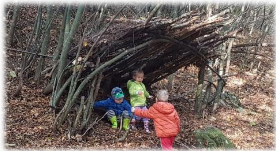
„Hiše v gradnji.“