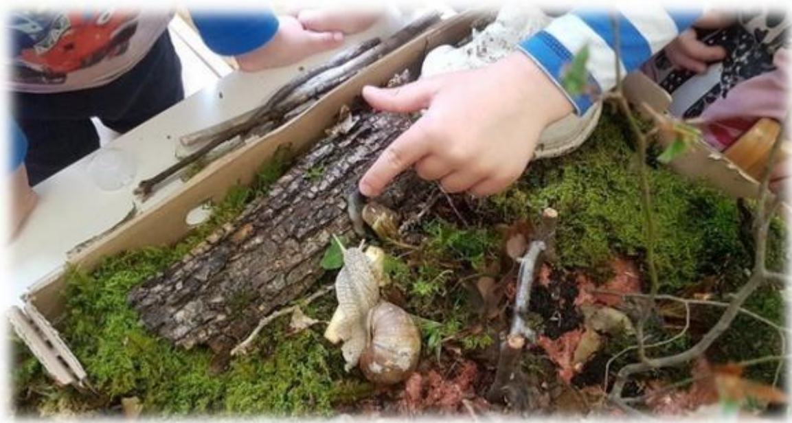
Gozdna maketa s polžki.