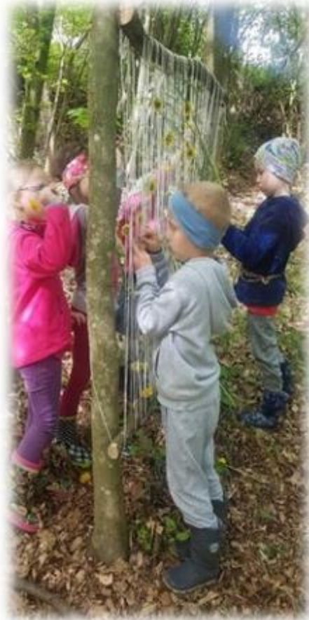
Prepoznavanje gozdnih in travniških rastlin.