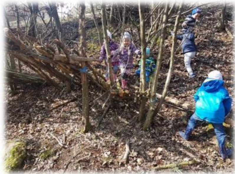
Zbiranje naravnega materiala in primernega prostora za hiško.