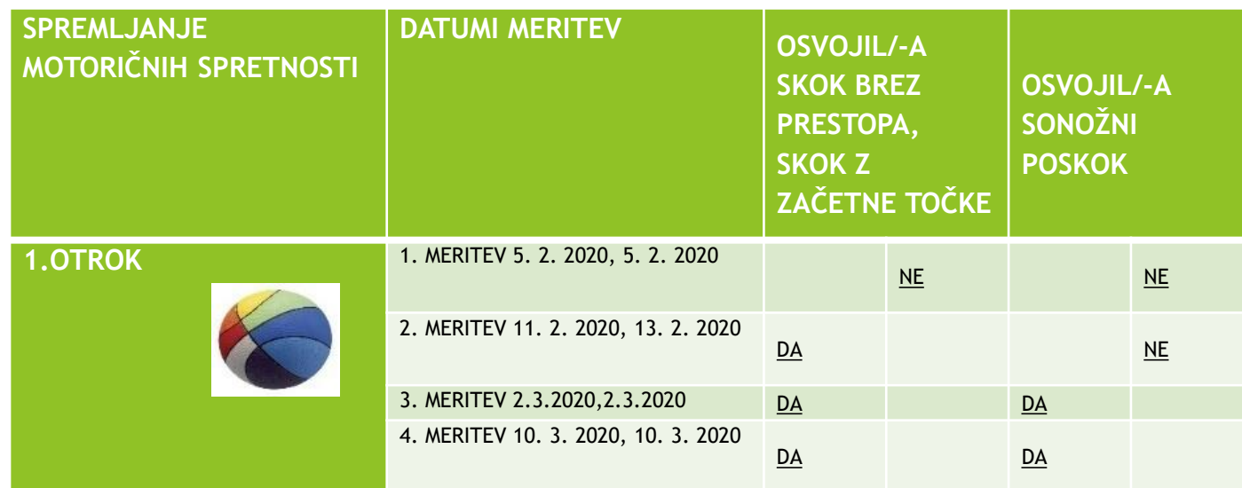
TABELA 1: SKOK V DALJINO

Primer ocenjevalnega lista-tabela spremljanja talnih iger: