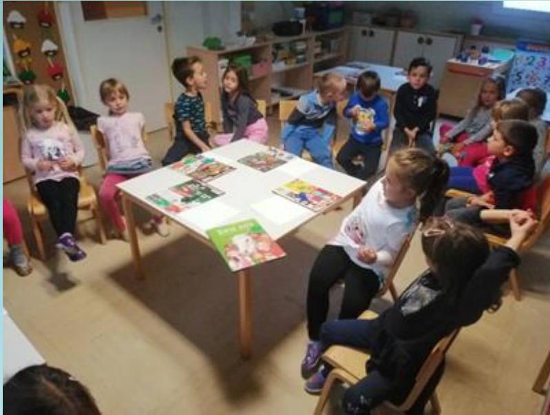
MOTIVACIJA: ZGODBA BELA POT