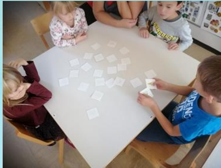
IGRA MLEČNEGA SPOMINA