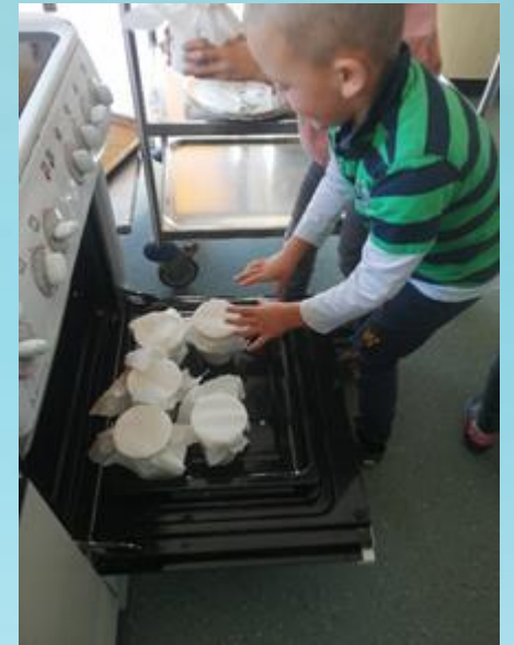
ZORENJE V PEČICI