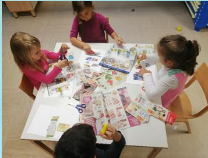
PREPOZNAVANJE V REKLAMNEM PAPIRJU