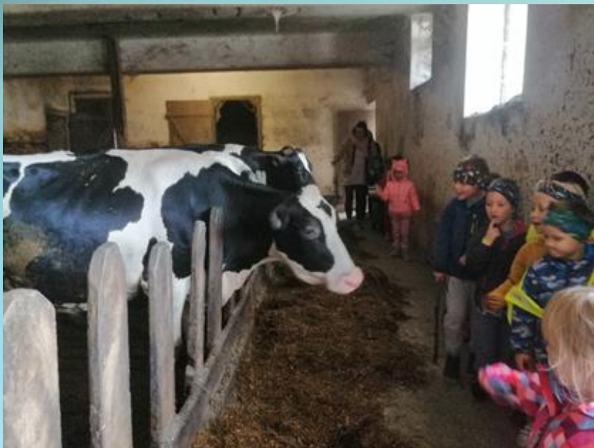
OGLED HLEVA IN KRAV