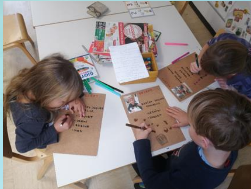
IZDELAVA RECEPTA ZA SADNI JOGURT