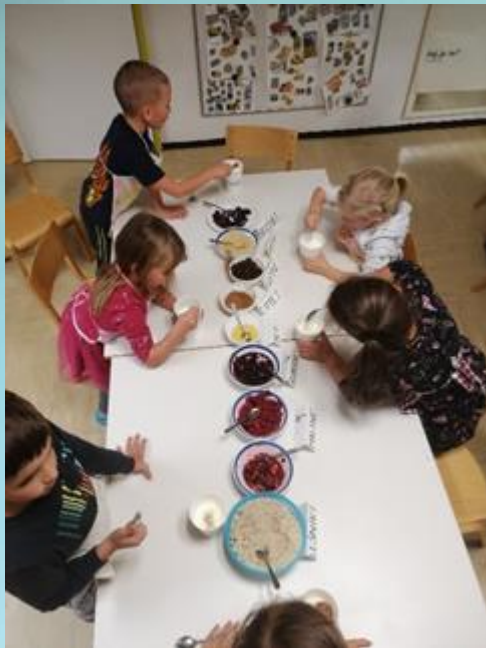
IZDELAVA SADNEGA JOGURTA