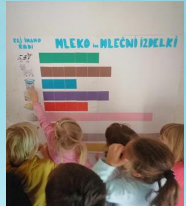
IZDELAVA STOLPIČNEGA DIAGRAMA