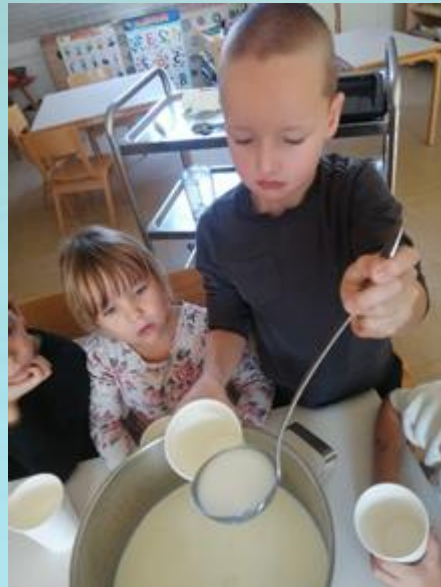
POLNJENJE KOZARCEV Z MLEKOM