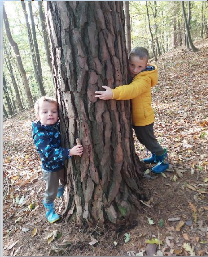
... pogovor z njimi, ...