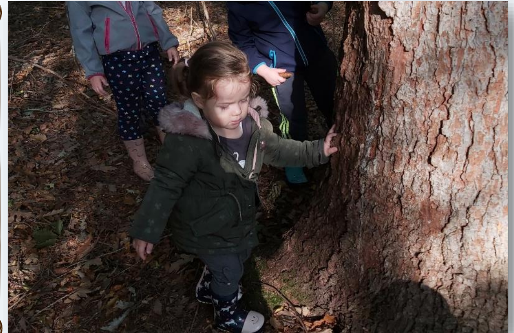
... ogrevanje ostalih delov telesa, ...