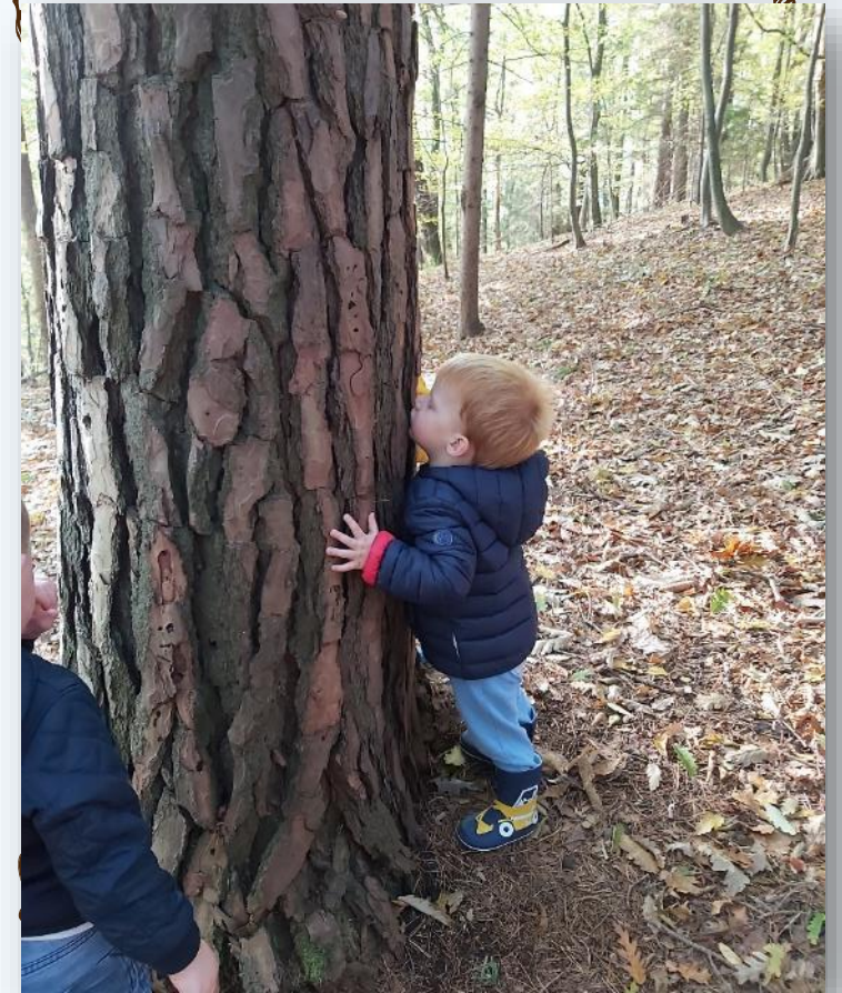
... nekateri svoje drevo tudi polupčkajo ;)