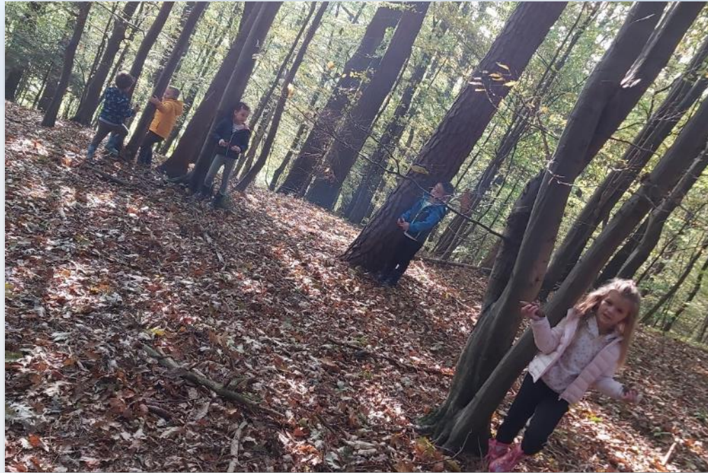
Uvodni del gibalne dejavnosti; gibalna igra Medved stopa, primerna za vse starosti