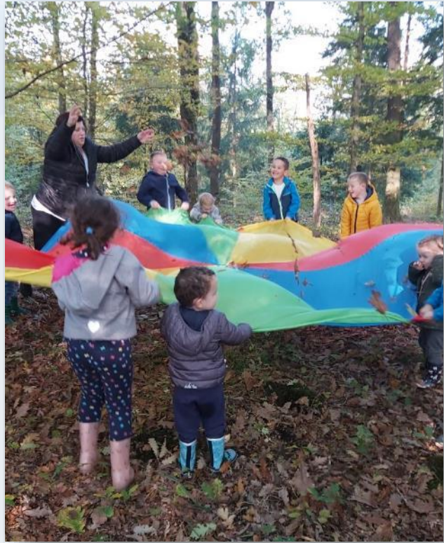
igra vrtiljak s padalom