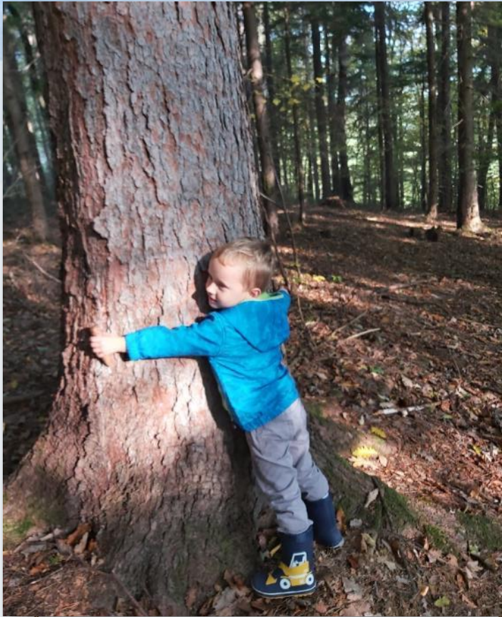
... poseben ritual; objemanje dreves ...