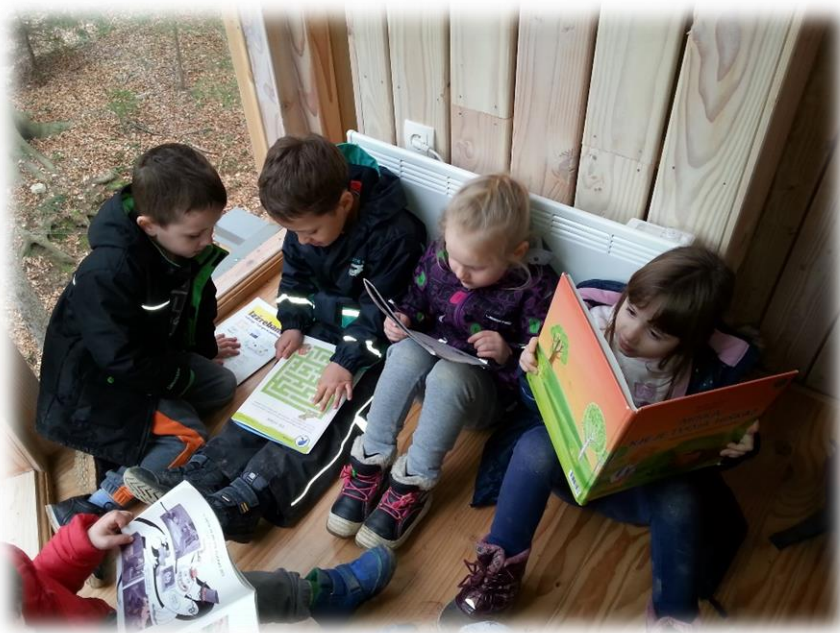
Dopoldne v drevesni hiški