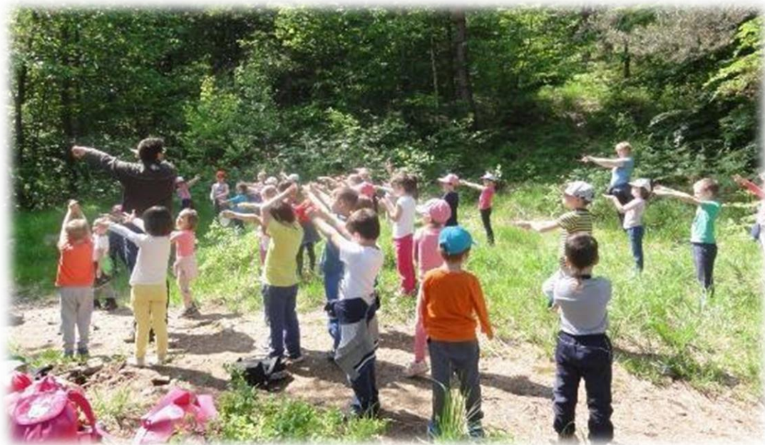
Gibanje v naravi