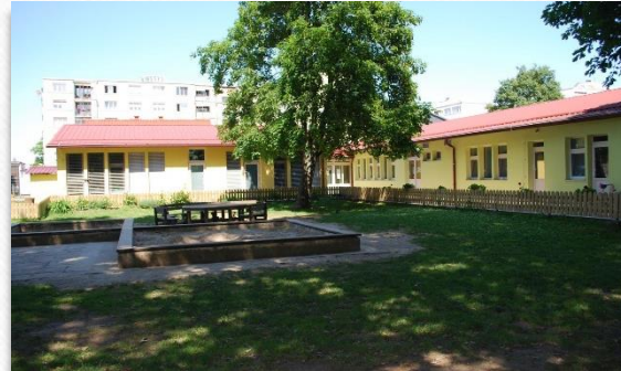
Organizacijska enota Cesta Zmage