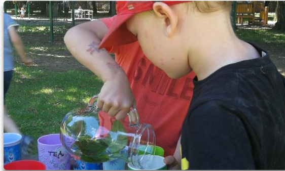
Osvežilni zeliščni napitki.