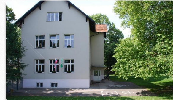
Organizacijska enota Ob gozdu