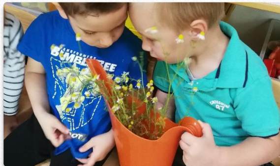
To je kamilica!