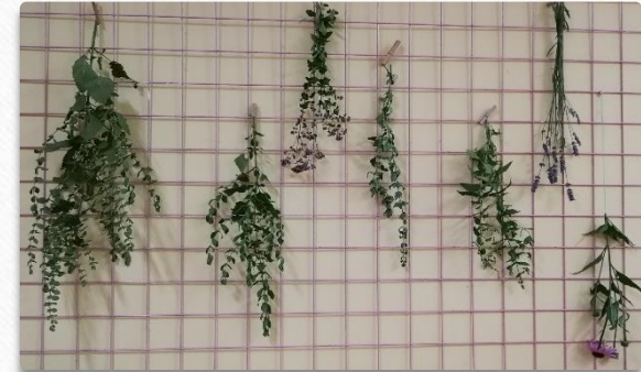
Sušenje in razstava zelišč.