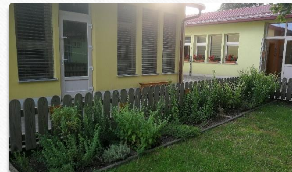
Zeliščni vrt s trajnicami.