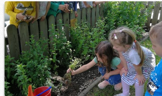
Posadili smo kamilico.