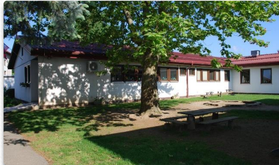
Organizacijska enota Betnavska

3 enote vrtca, 20 skupin, 45 vzgojiteljev, 378 otrok