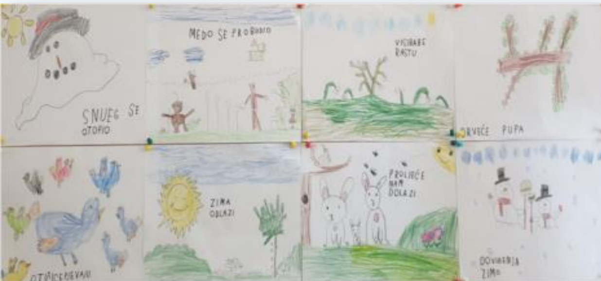
Proletna čarolija buđenja - "Gumbići" (Resica)