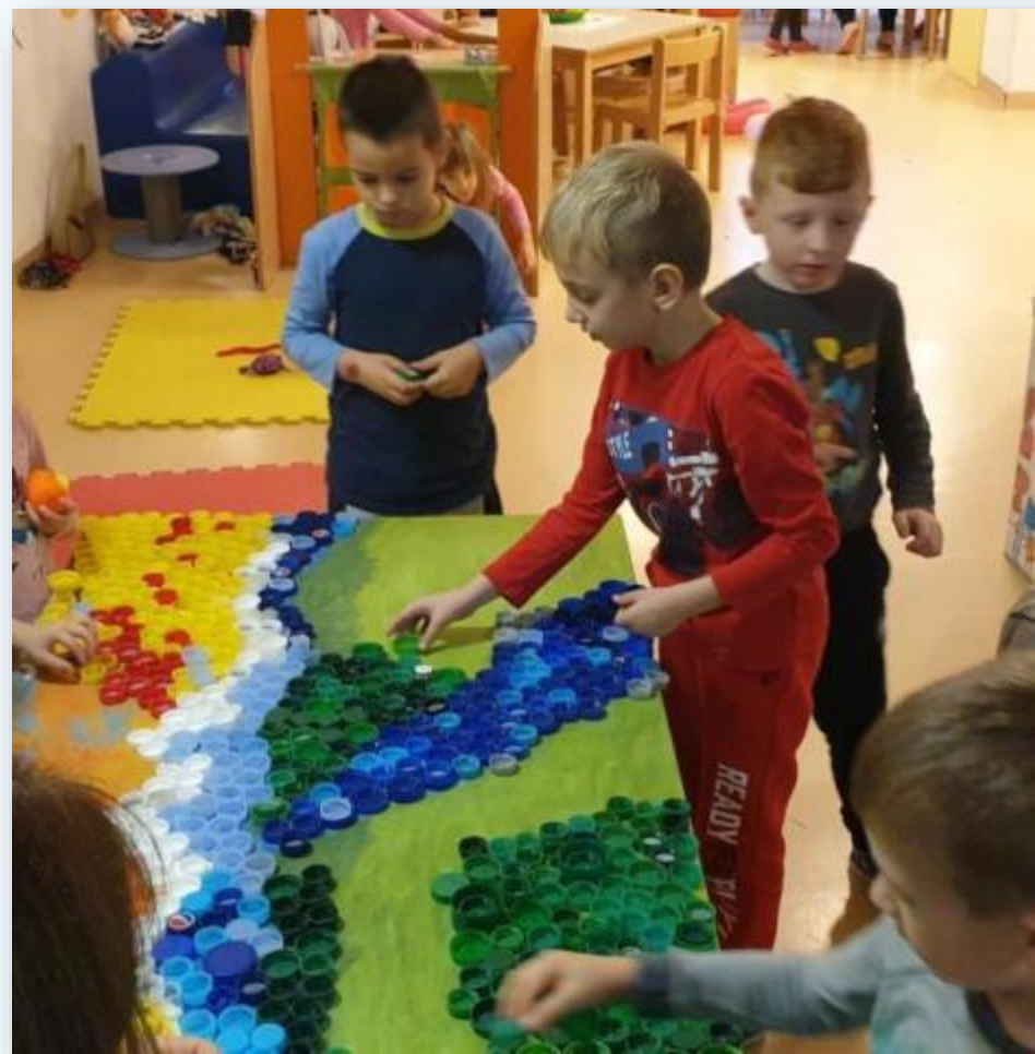
Izrada slike od plastičnih čepova