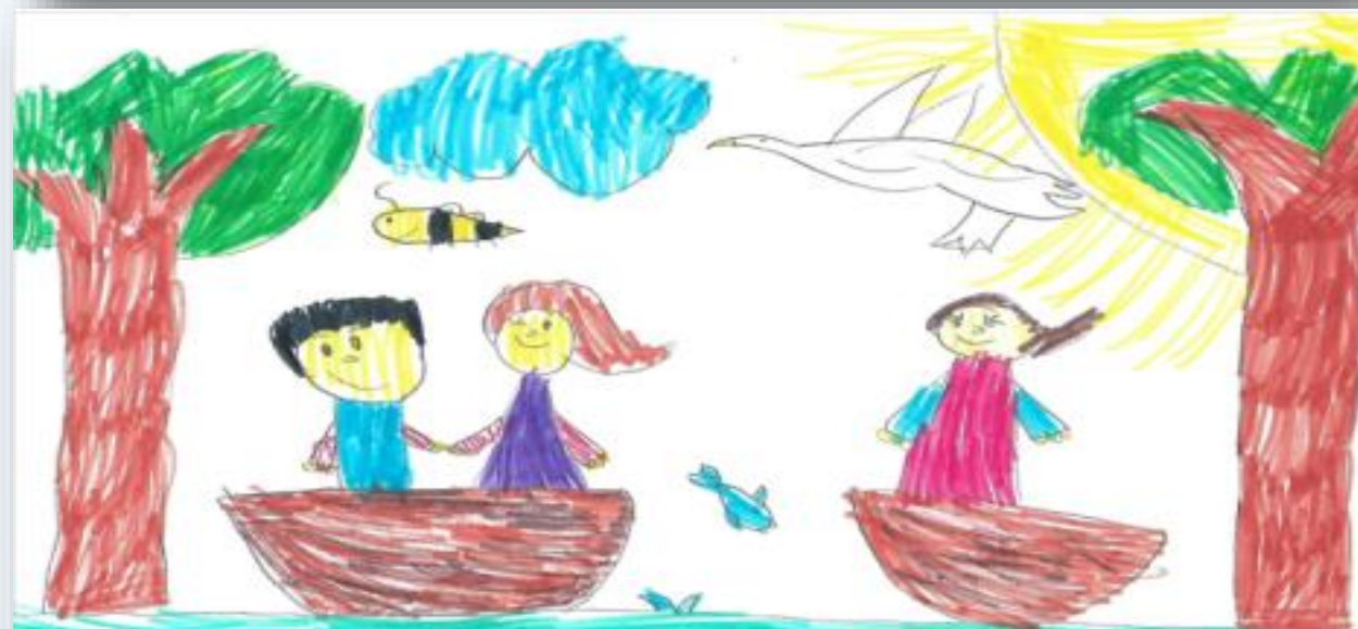
"Ljubav na rijeci Mrežnici u proljeće" - Sonja (Gumbići)