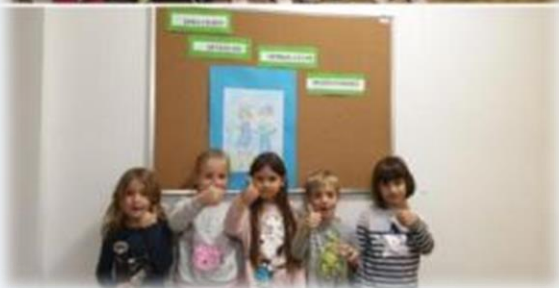
Uređenje ulaznog prostora vrtića