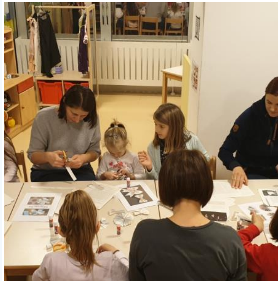
Božićna eko radionica