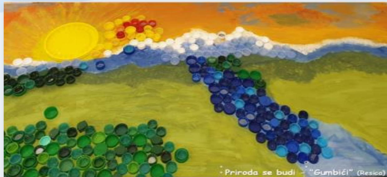
Priloga se budi - "Gumbići" (Resica)