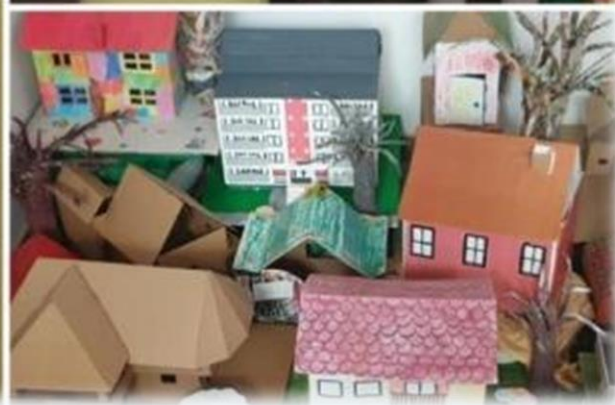
Aktivnost na temu „Moj dom, moja ulica, moj grad”