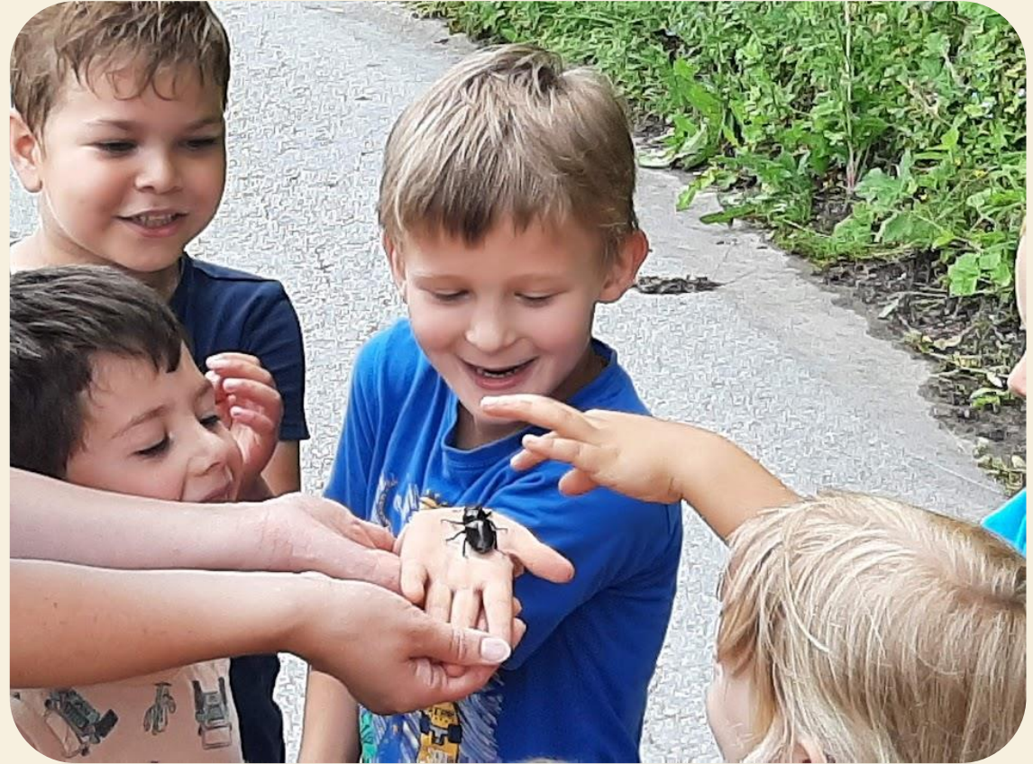
Opazovanje in stik z živalmi