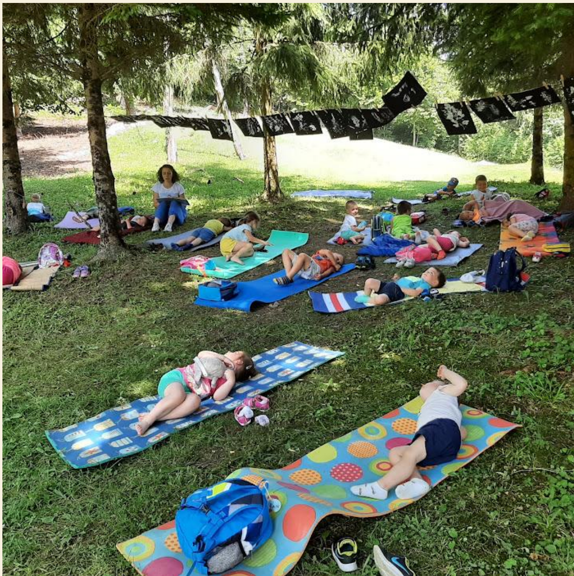
Pravljica v senci dreves