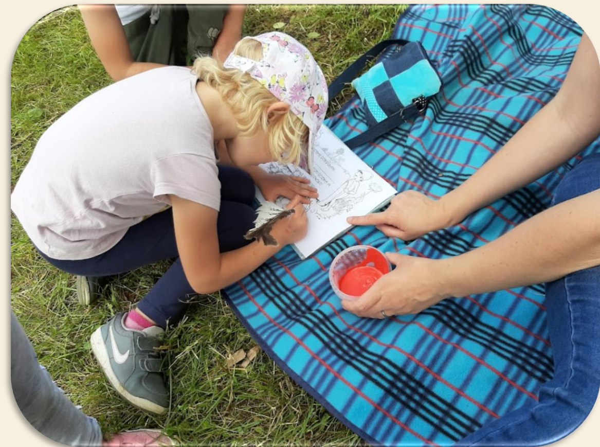
Podpis gozdne listine