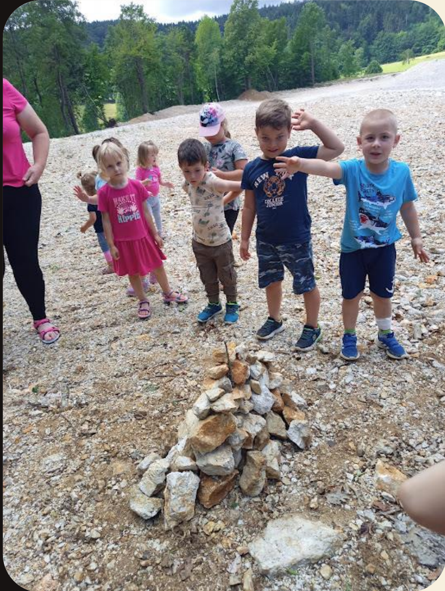
Igra z naravnimi materiali