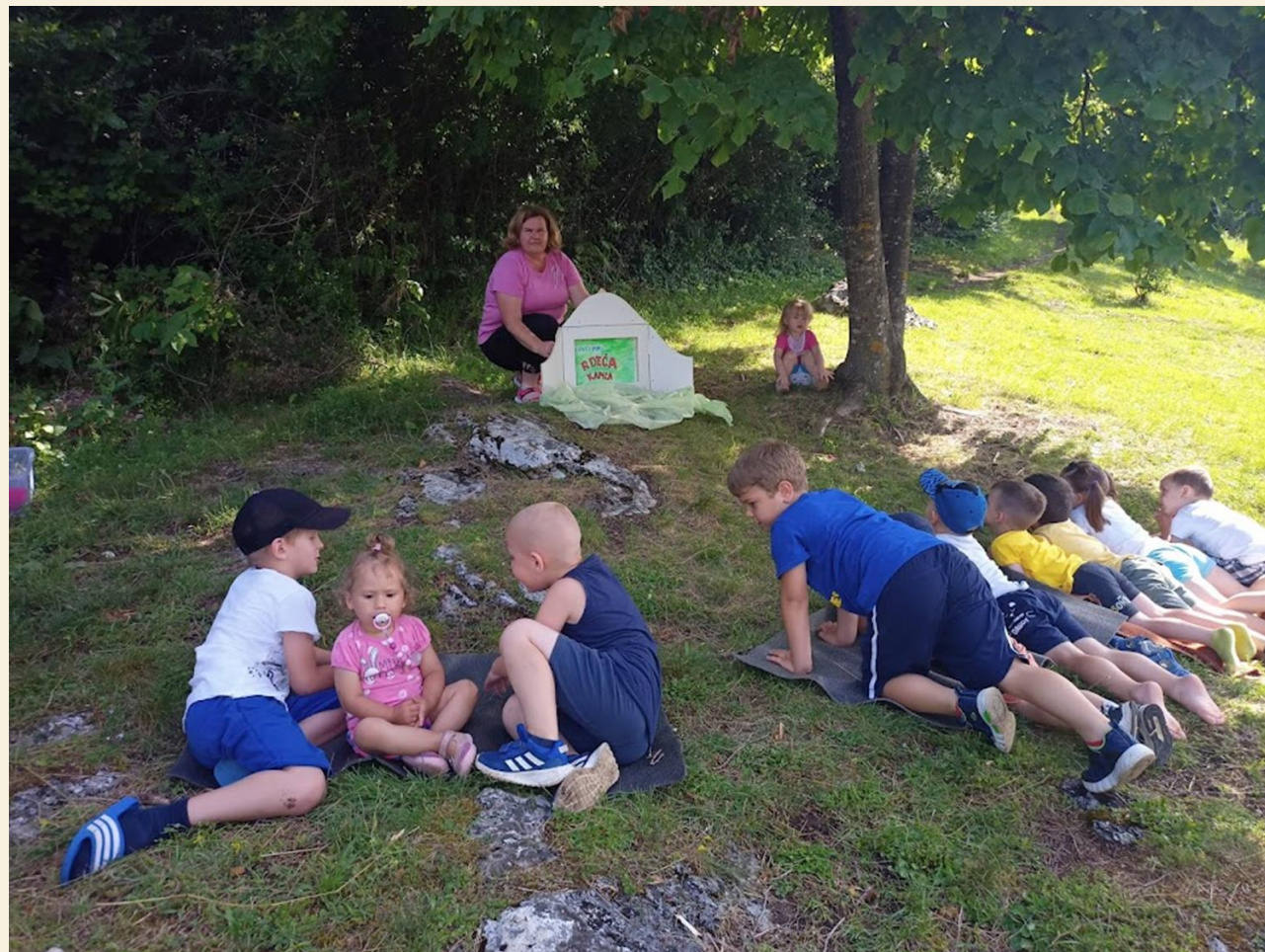
Kamišibaj na gozdni jasi