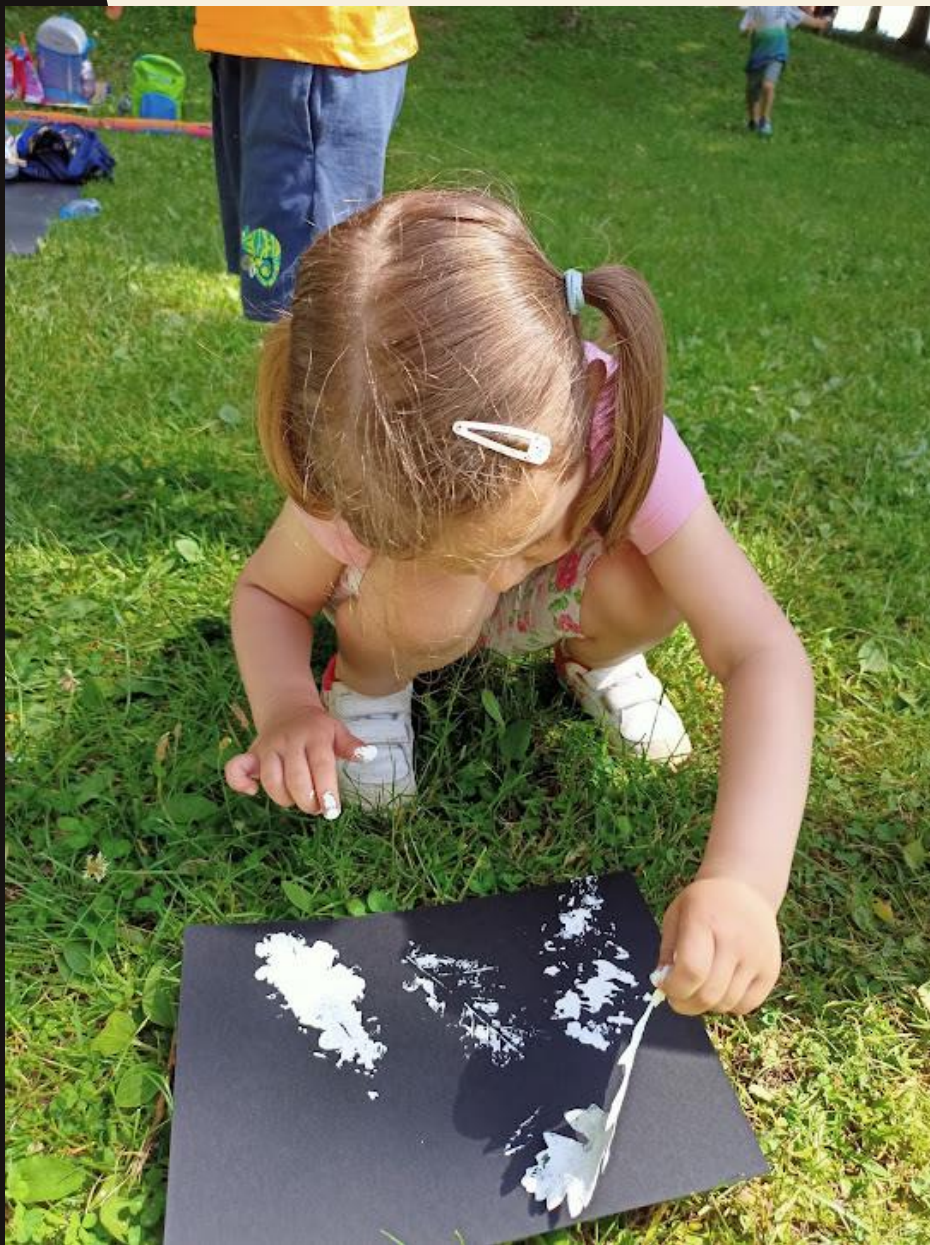
Tiskanje z rastlinami.