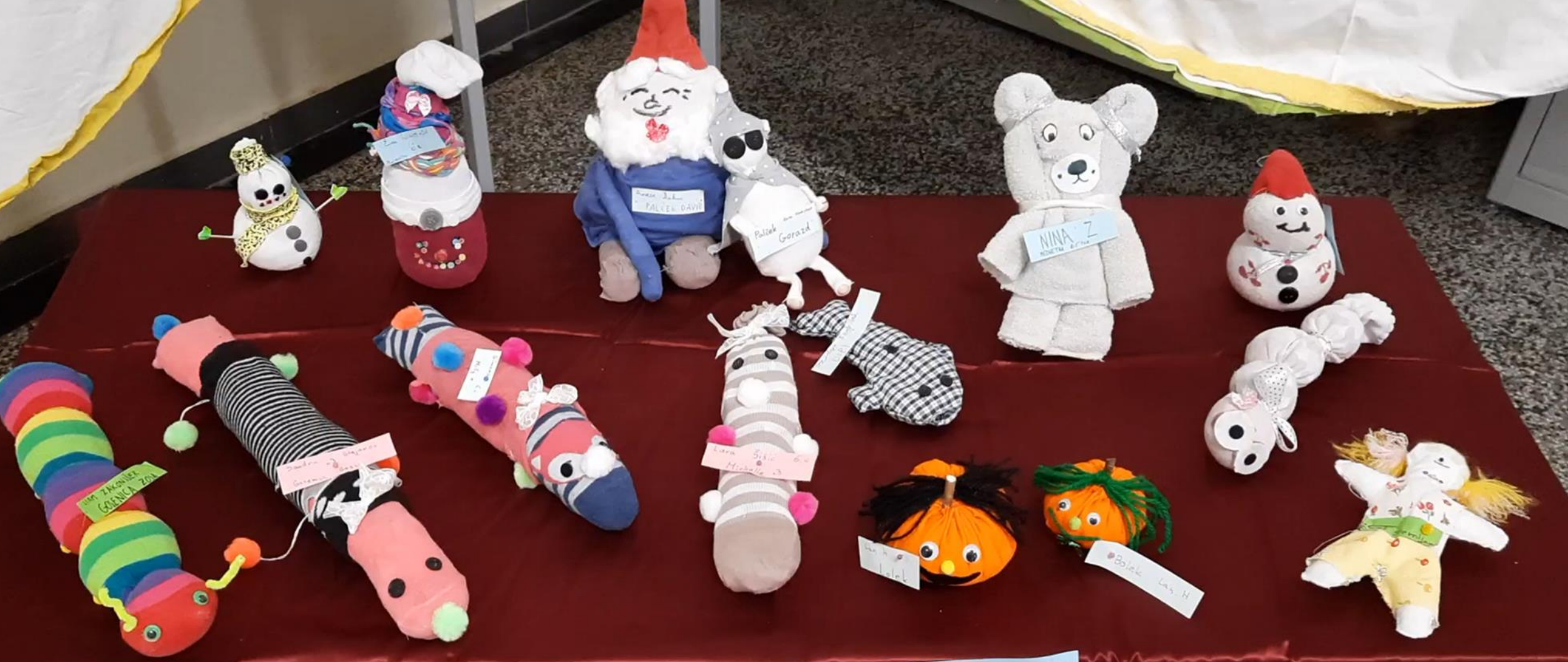
USTVARJANJE IZ ODPADNEGA TEKSTILA Gos 6.cj