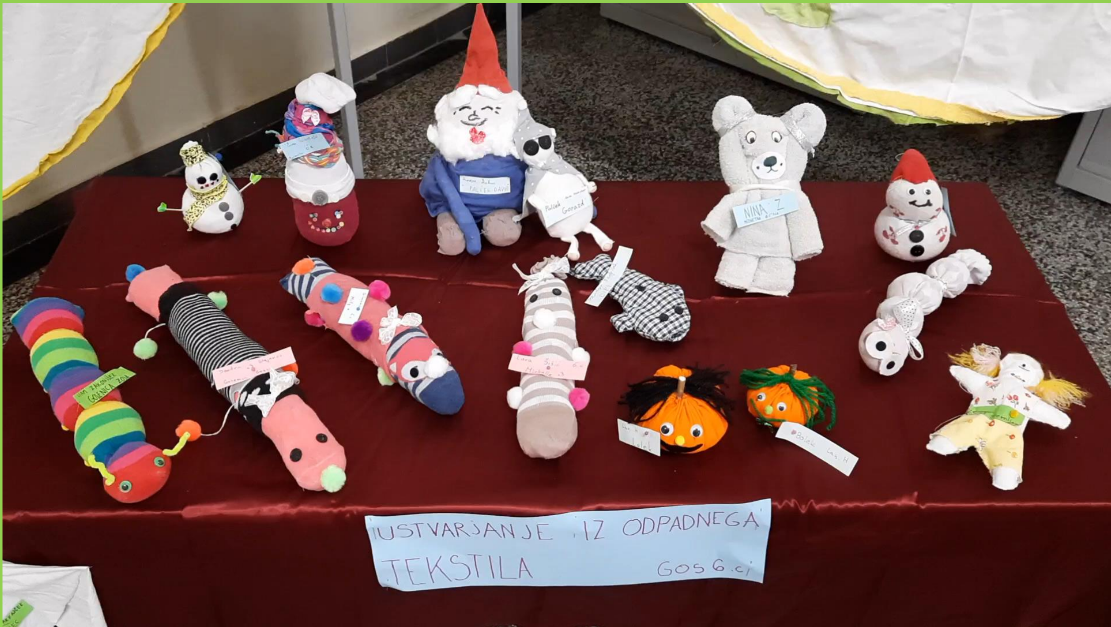
IUSTVARJANJE IZ ODPADNEGA TEKSTILA Gos 6.aj