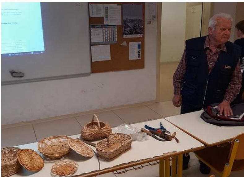
Prvo srečanje s pletarjem