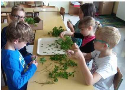
Šolski vrt in njegovi pridelki