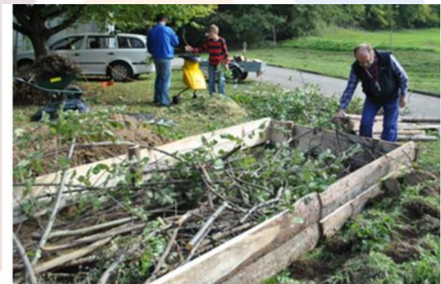
Urejanje visoke grede