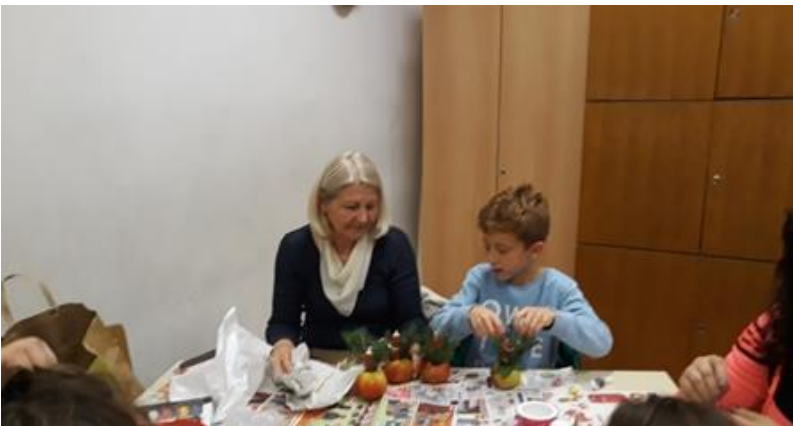
SURADNJA S RODITELJIMA Radionica izrade nakita s temom jabuka, Dani kruha i izrada študle od jabuka.