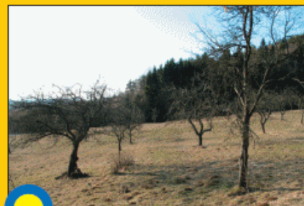
KOTAVLIJA - OPUŠČENI STARI SADOVNJAK