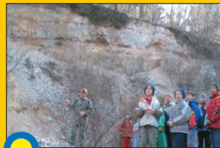
SUHI POTOK - OPUŠČENI PESKOKOP