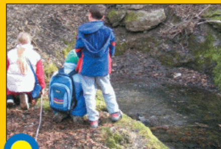
BEČ - KRAŠKI ZDRAVLJNI IZVIR