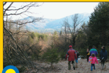
SENOŽETI - TRAVNIKI V ZARAŠČANJU