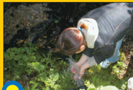
MOKRIŠČE NA LOČICAH