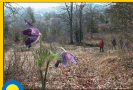
JASA - RASTIŠČE GORSKEGA KOSMATINCA