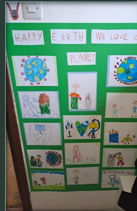
AKTIVNOST - Plakat "Happy Earth"