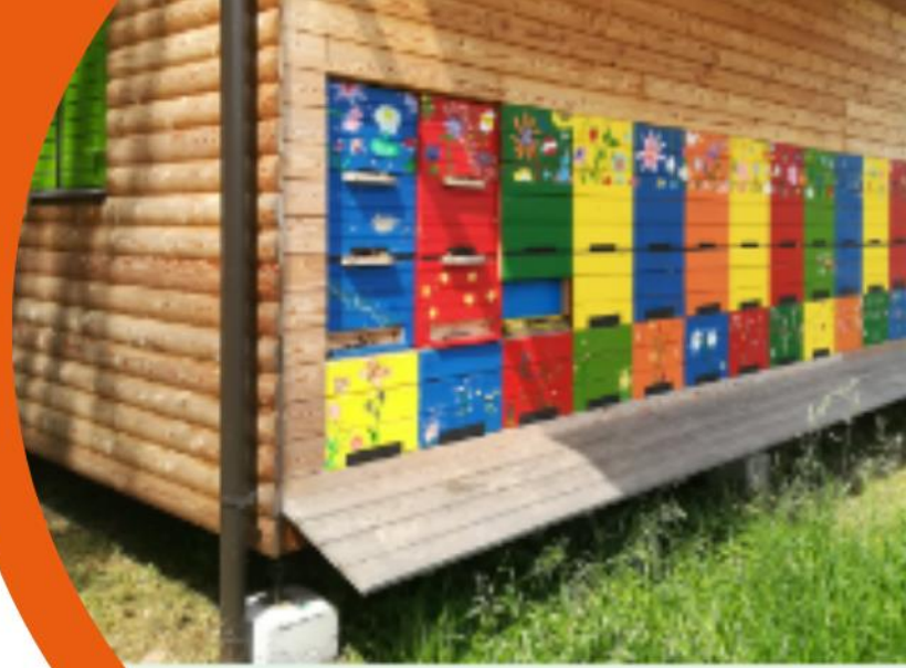
niak v šolskem okolju