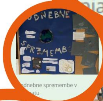
podnebne spremembe v ...