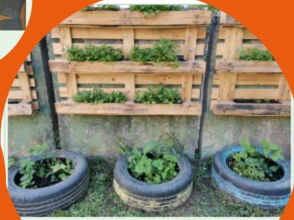
ovrtiček iz lesenih palet na