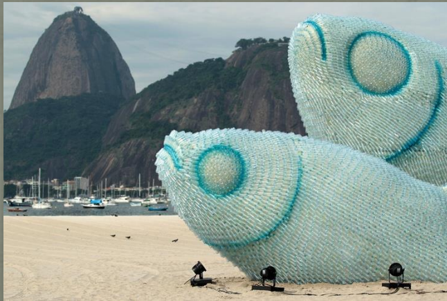
Recycled plastic bottle fish sculpture. Rio de Janeiro, Brazil. Slika 8