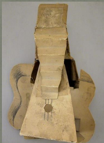
Pablo Picasso, "Kitara", 1912 slika 2