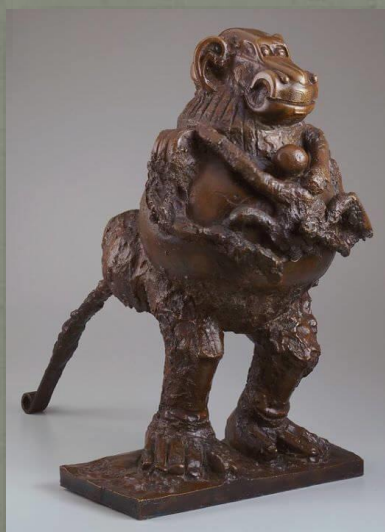
Pablo Picasso, "Pavijan z mladim", 1951 slika 4