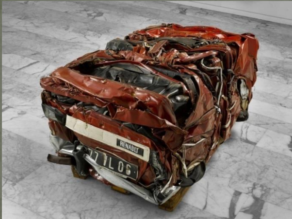
César Baldaccini, “Renault VL 06”, 1989 slika 5