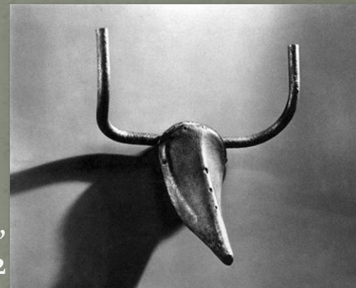
Pablo Picasso, "Bikova glava", 1942 slika 3