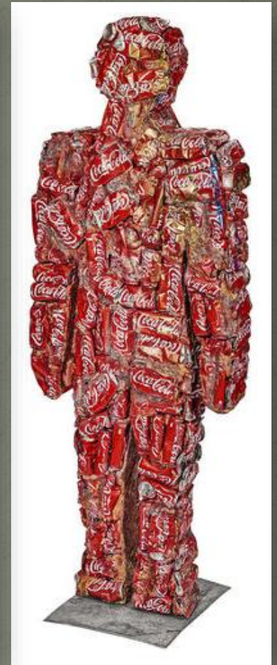
HA Schult, “Trash People” Slika 6