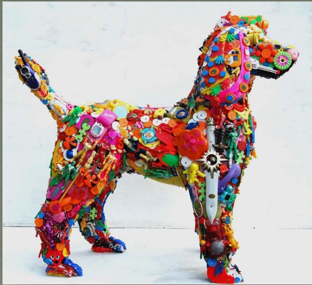
Robert Bradford, Recycled Toy Sculptures, slika 7