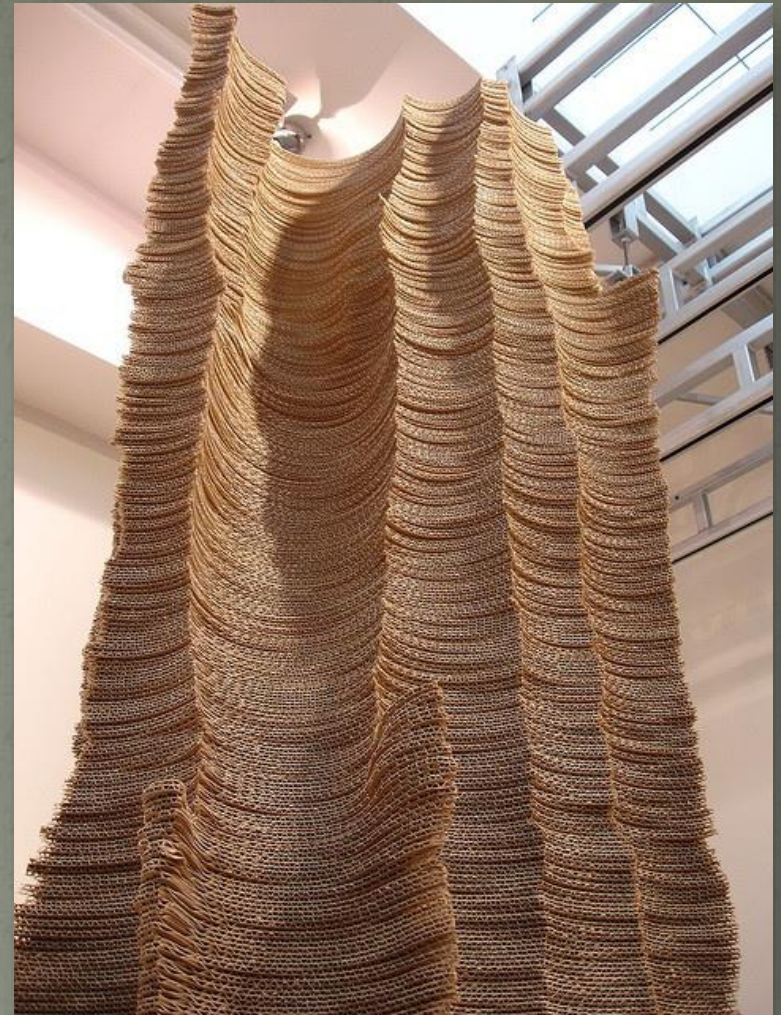
Tobias Putrih, Cardboard Sculpture slika 9