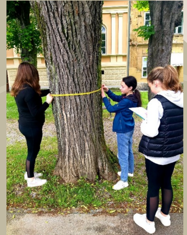
Stablo divljeg kestena na karlovačkoj Promenadi 84 godina staro (1940.)