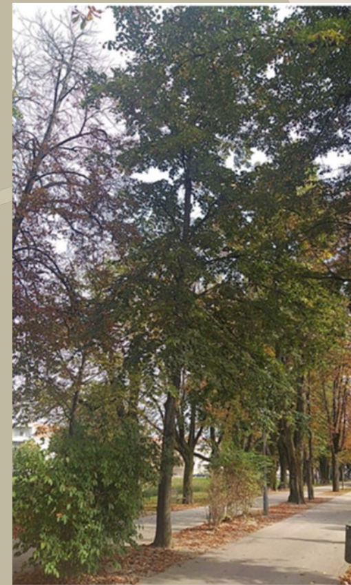
Stablo divljeg kestena na karlovačkoj Promenadi 34 godina staro (1990.)