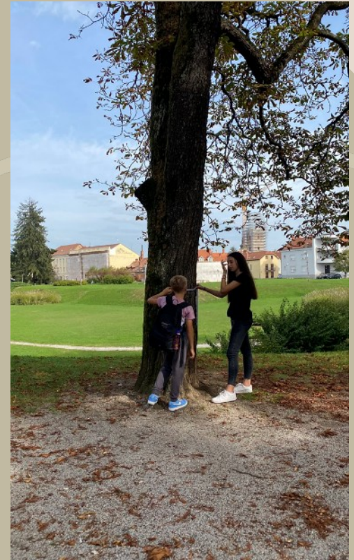
Stablo divljeg kestena na karlovačkoj Promenadi 68 godina staro (1956.)