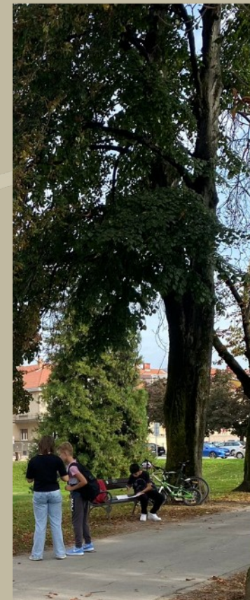
Stablo divljeg kestena na karlovačkoj Promenadi 106 godina staro (1918.)

Promenade, podaci o vremenu sadnje čuvajmo ih u karlovačke Zvijezde