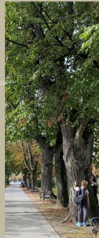
Stablo divljeg kestena na karlovačkoj Promenadi 106 godina staro (1918.)