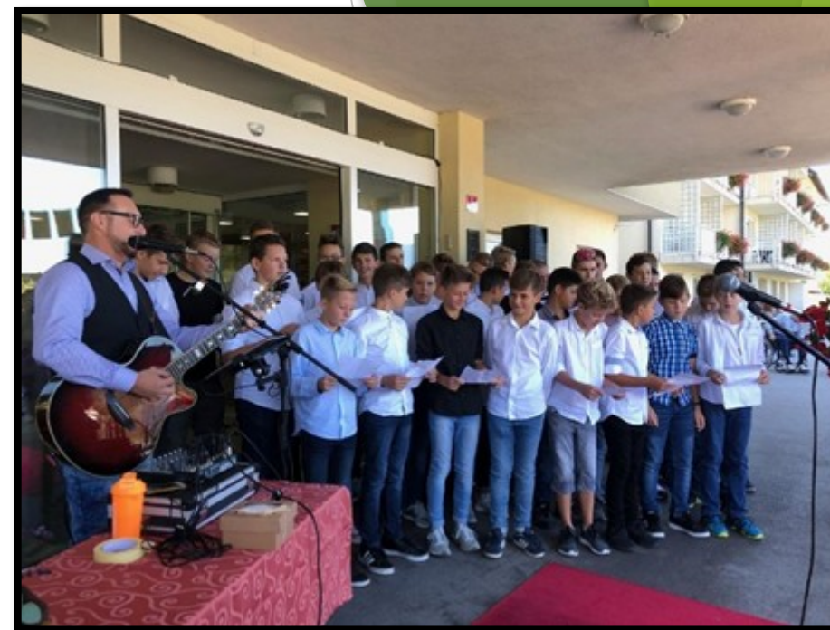
Modna revija in nastop v DEOS centru oхранjanje stikov