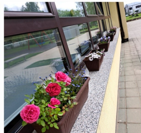
Panj i kamenčići