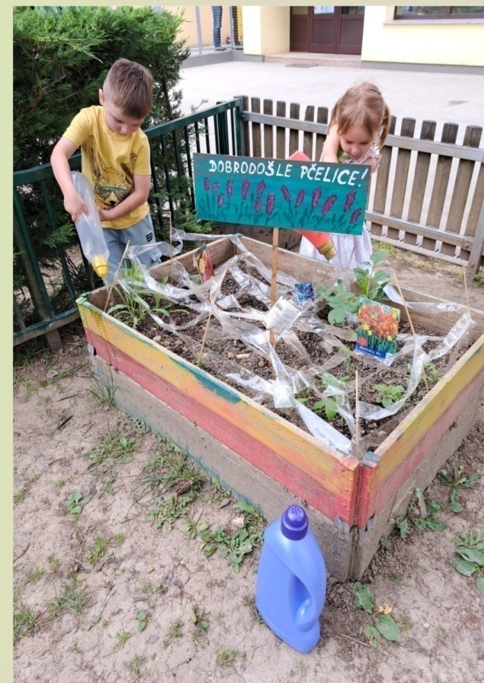
Boce od deterdženta