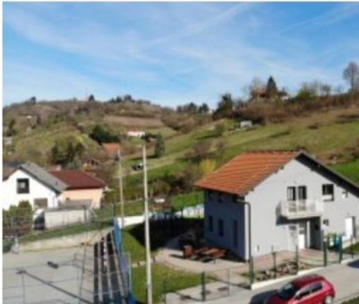
Objekt Jagnjić Dol