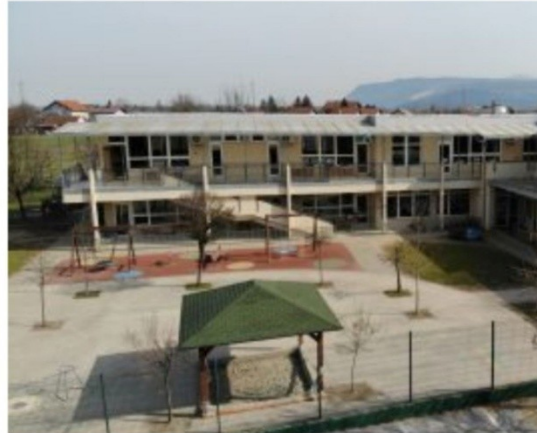
Središnji vrtić Slavuj Strmec