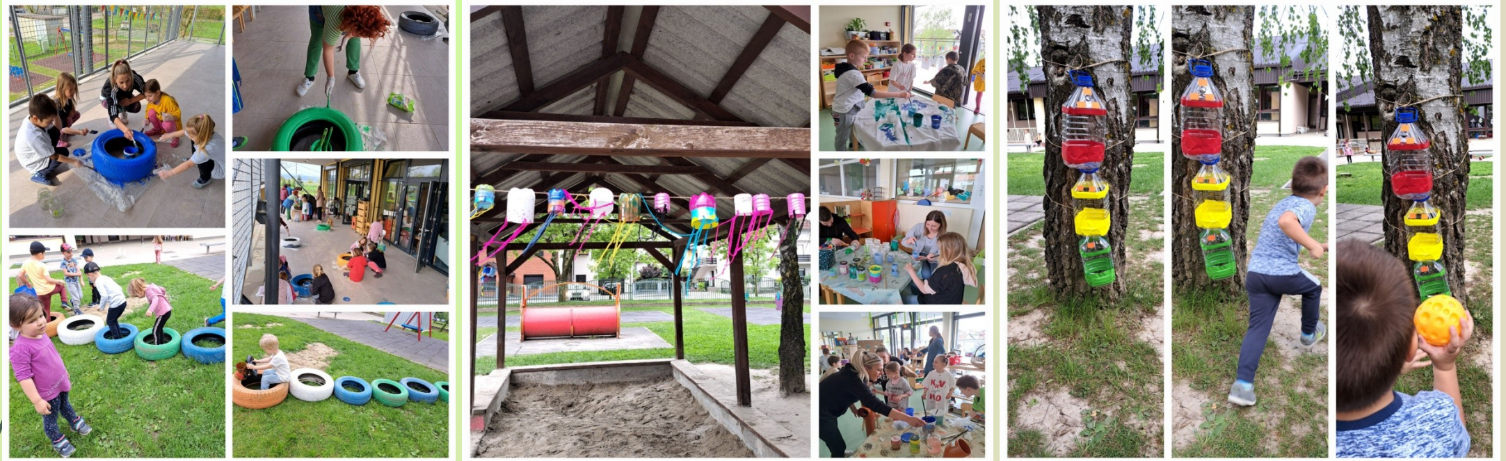
Stare auto gume