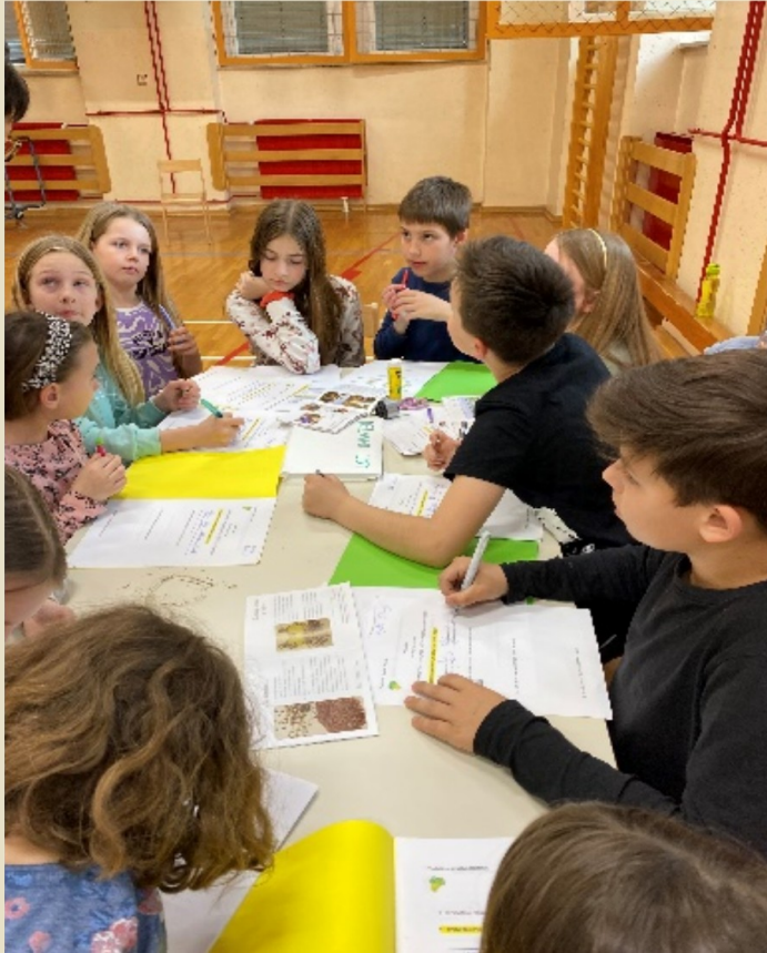
Slika 17: Reševanje učnih listov za starejše učence