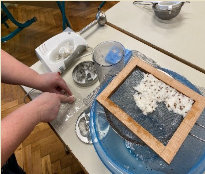
Slika 19: Izdelava semenske bombice

❖ Z delavnicami kasneje smo se pripravljali na sejem Altermed