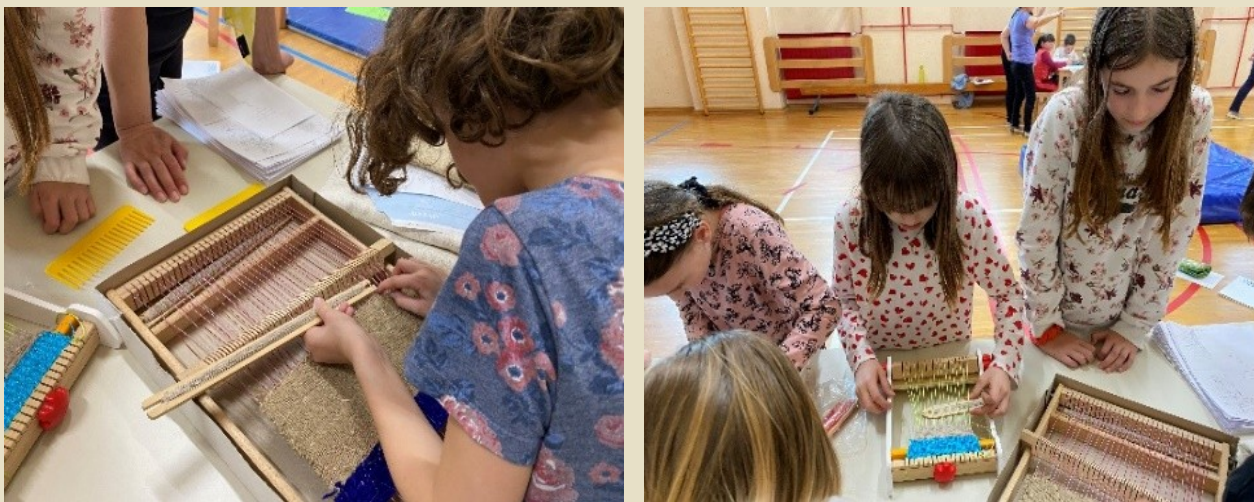
Sliki 13, 14: Tkanje lanenih niti