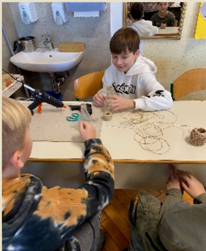
Slika 22: Izdelava vazic za materinski dan