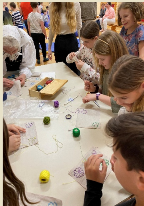
Slika 15, 16: Vezenje na laneno blago