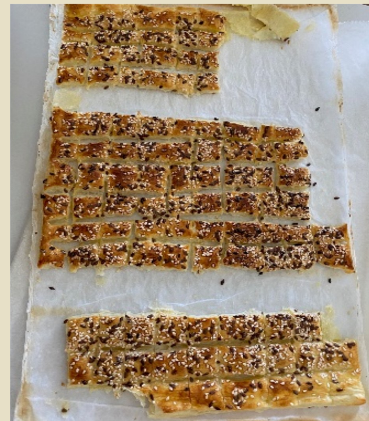
Sliki 23, 24: Peka z lanenimi semeni