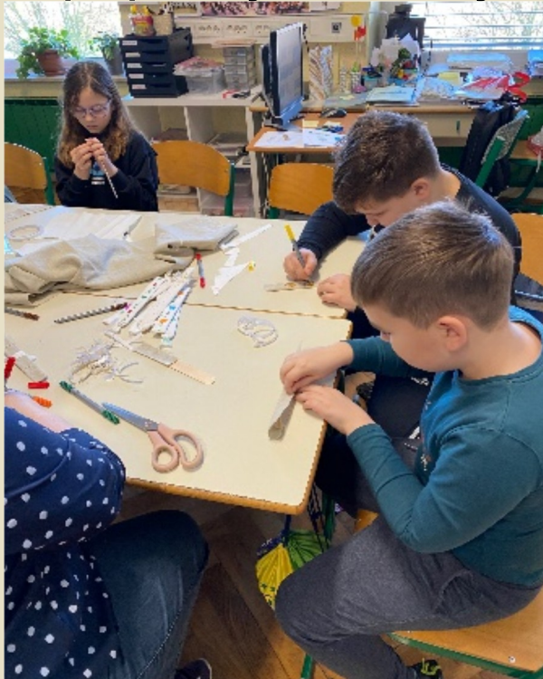
Slika 20: Izdelava knjižnih kazalk iz lanenega blaga