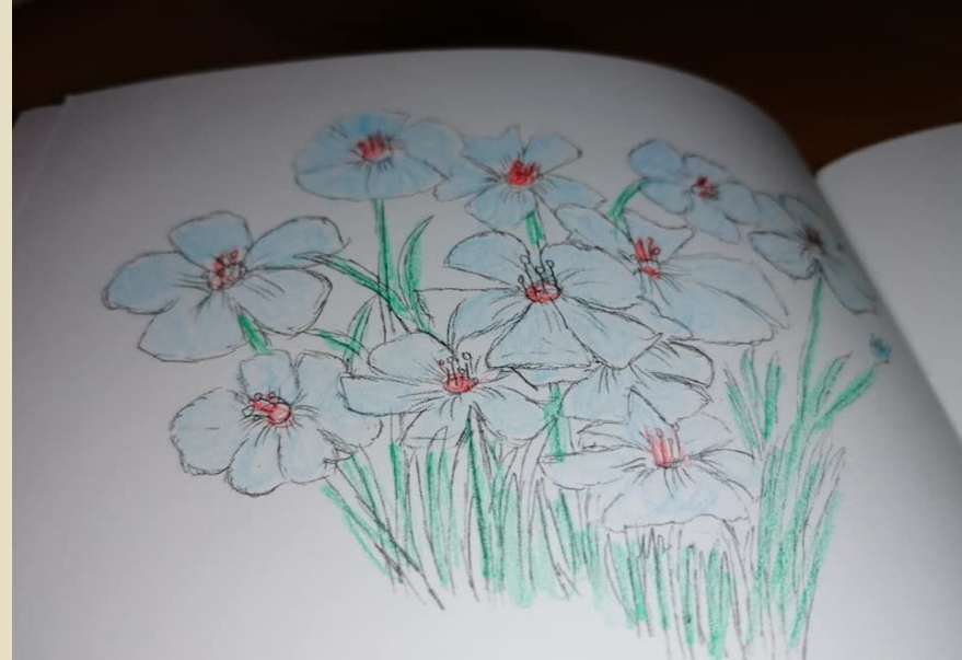
Slika 18: Pobarvanka za mlajše učence