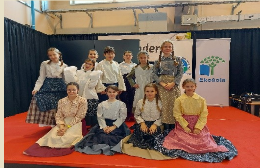
Sliki 28, 29: Demo oder – OFS OŠ Mladika - Lan