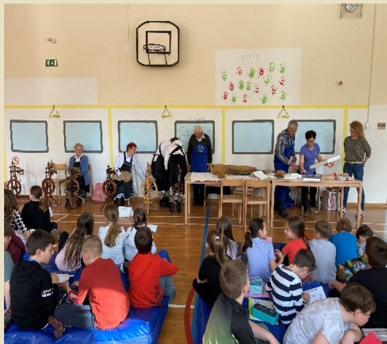
Slika 9: TD Destrnik