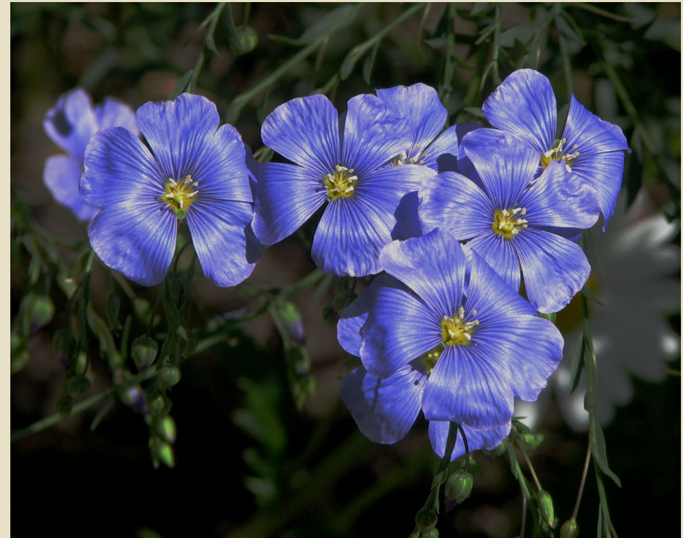
Slika 1: Cvetiči lan