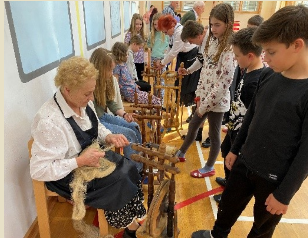
Slika 12: Delo s kolovrati – dobiš laneno nit