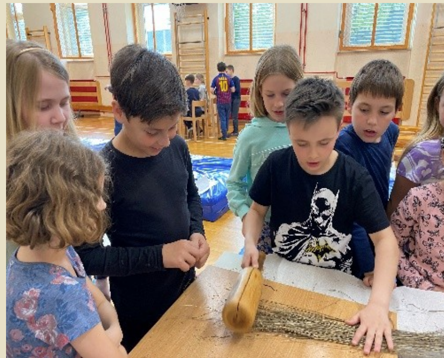
Slika 10: Lan z „batom“ potolčejo