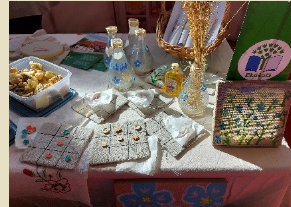
Slike 25, 26, 27: Stojnica na sejmu Altermed