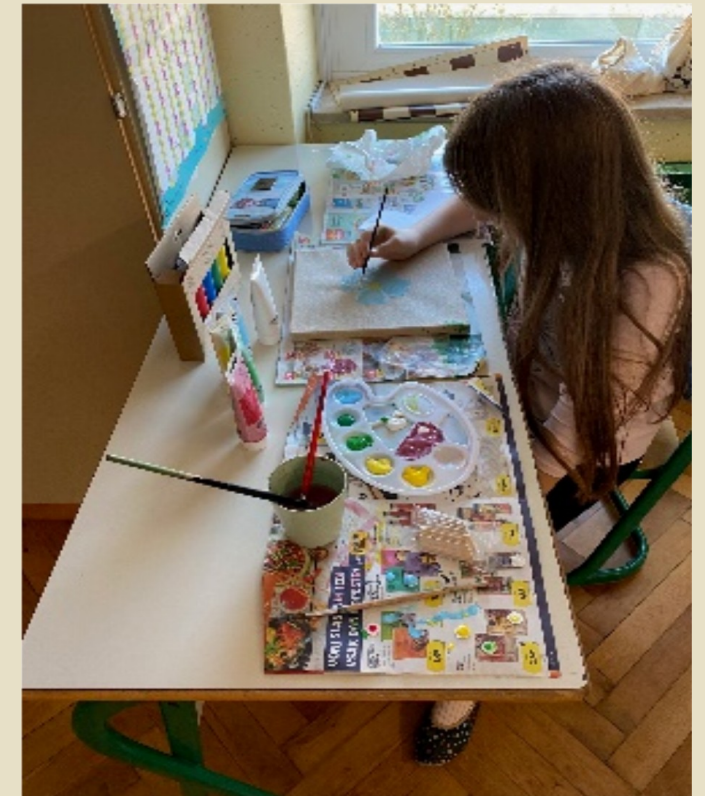
Slika 21: Slikanje lanu na platno