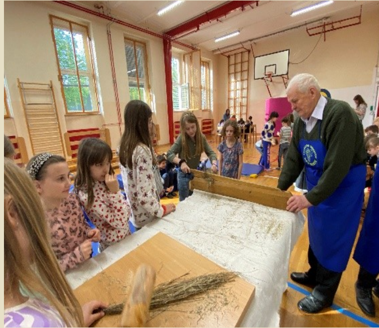
Slika 11: Lan s „trlicami“ strejo