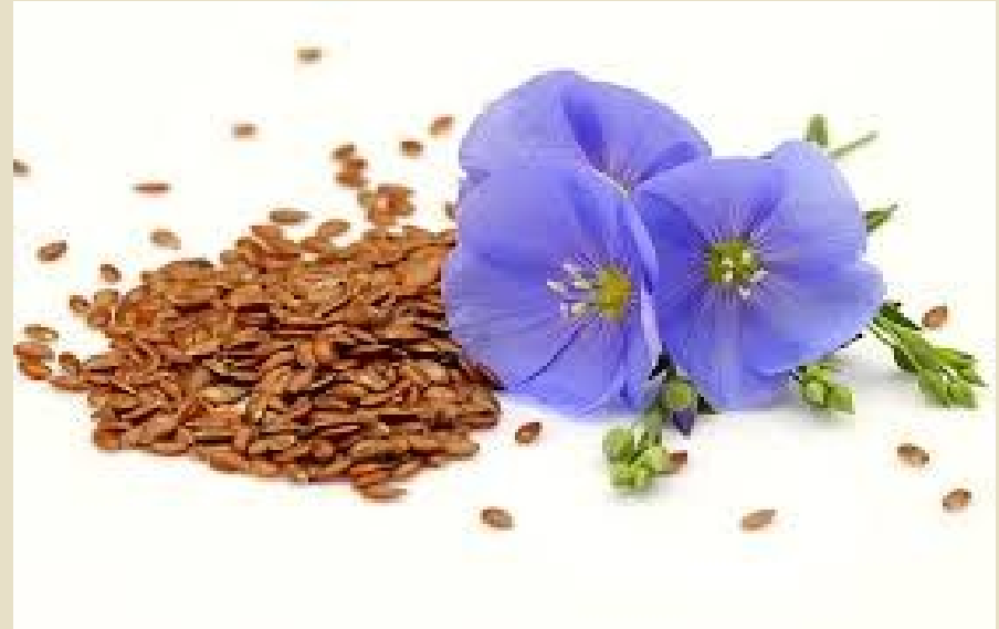
Slika 3: Lanena semena in cvet

Kulturni lan se lahko z gospodarskega vidika deli na preje, oljne preje in oljnice. Semena lanenega olja vsebujejo 30–40 % maščobe, 25 % beljakovin in 8 % vode. Rastlina ima eno glavno steblo z razvejanjem od dna stebela (več poganjkov). Barva semena se razlikuje glede na sorto in je lahko od rumene do srednje rjave.