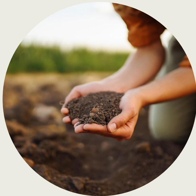
prsti po barvi