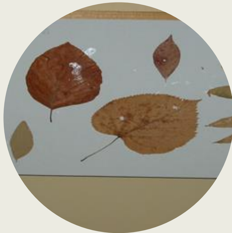
listnih ploskev po barvi, obliki, velikosti