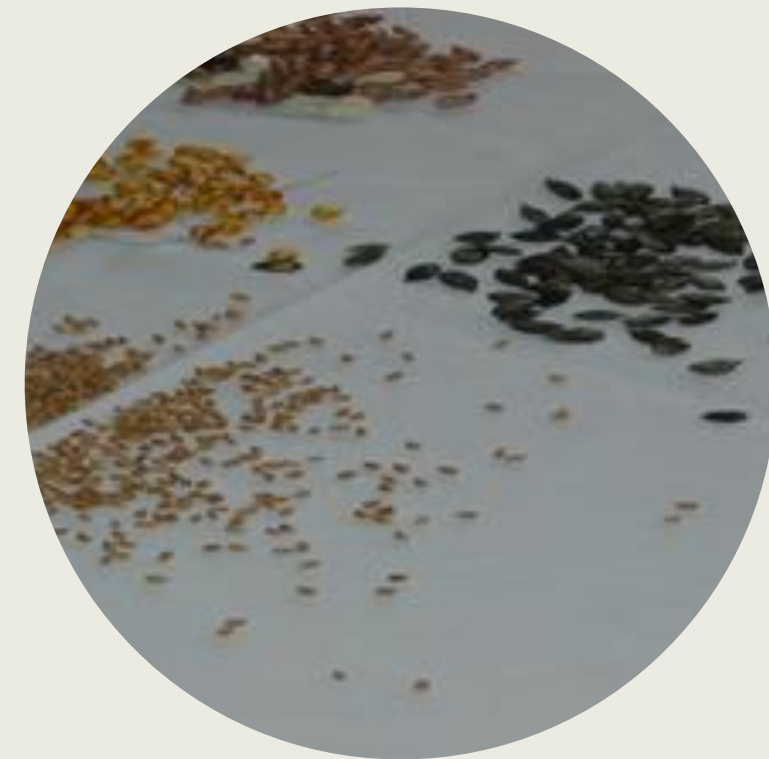
plodov in semen po barvi, obliki, velikosti