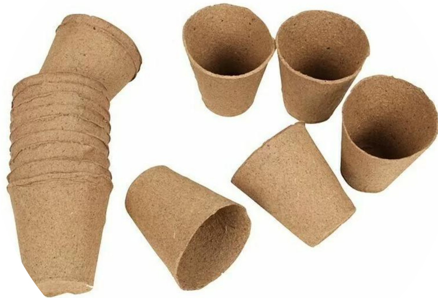
BIO RAZGRADLJIVI LONČKI ZA SAJENJE