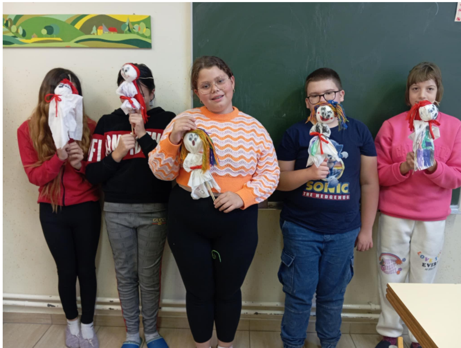
Papirne serviete niso samo za brisanje rok