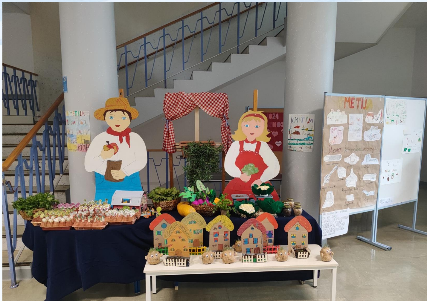
Tematske delavnice (LUM) in jesenska razstava v avli šole

sodelujoči: učenci in mentorji prve triade