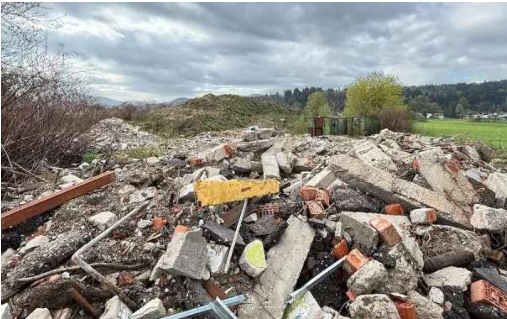
Slika 2: Kupi nezakonito odloženega gradbenega materiala