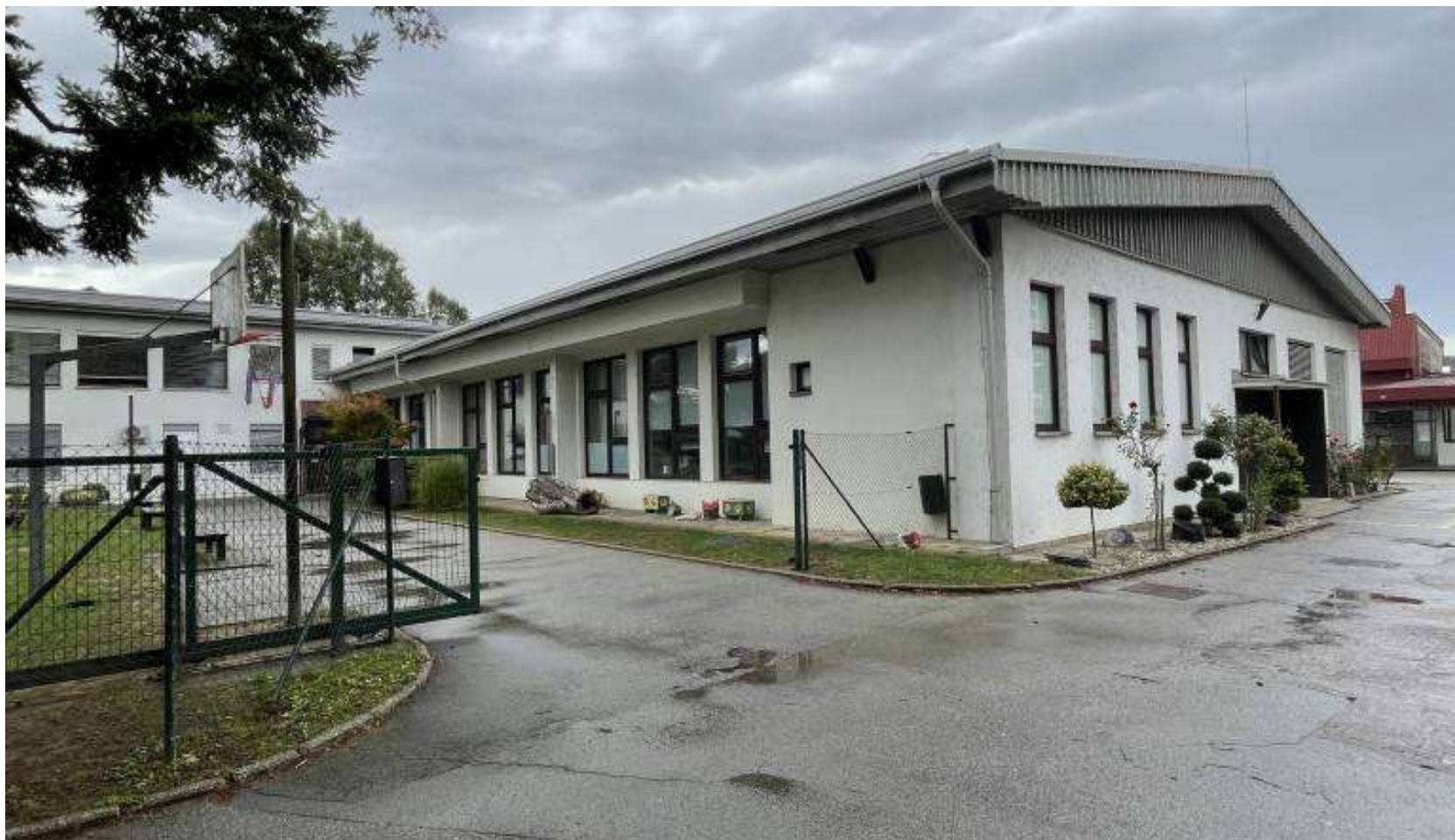
Slika 1: Osnovna šola IV Murska Sobota