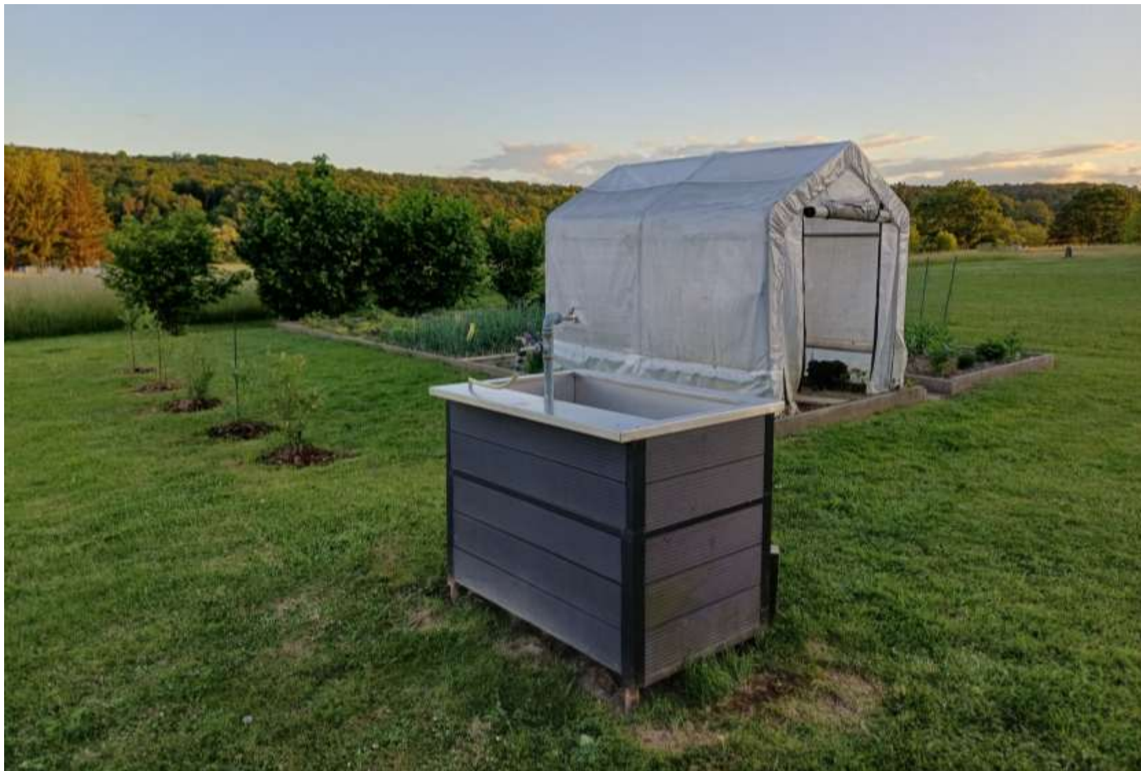
Slika 3: Moj vrt