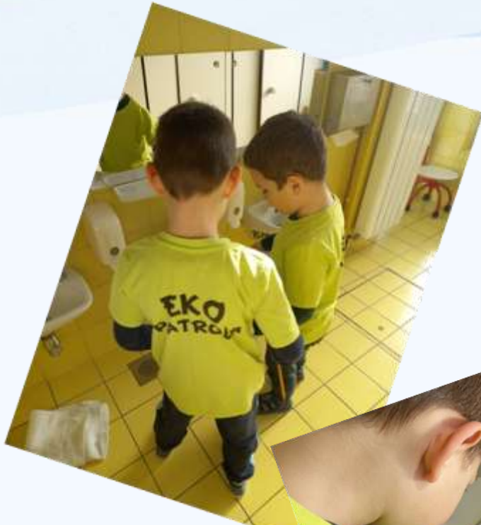
Aktivnosti praćenja stanja okoliša - Eko patrola