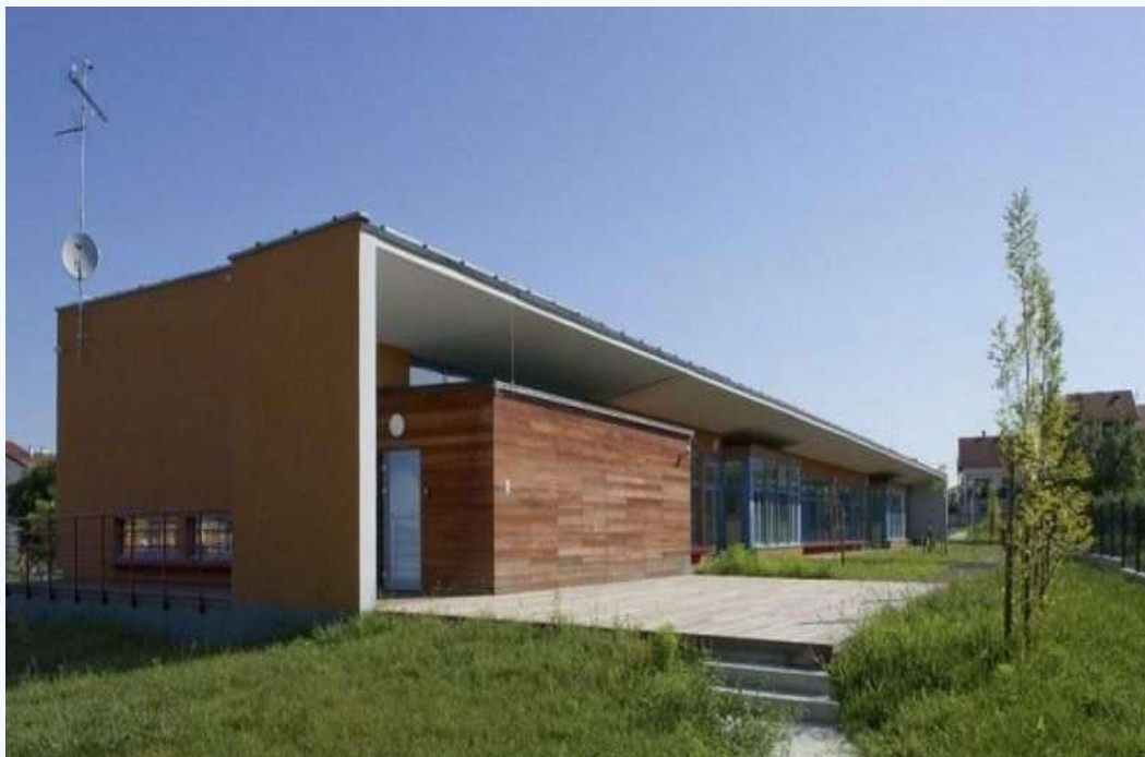
Dječji vrtić Turanj, prije stjecanja statusa Eko vrtića