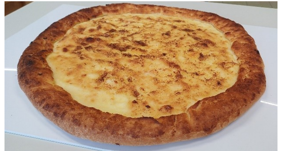
Jed Cop na lop