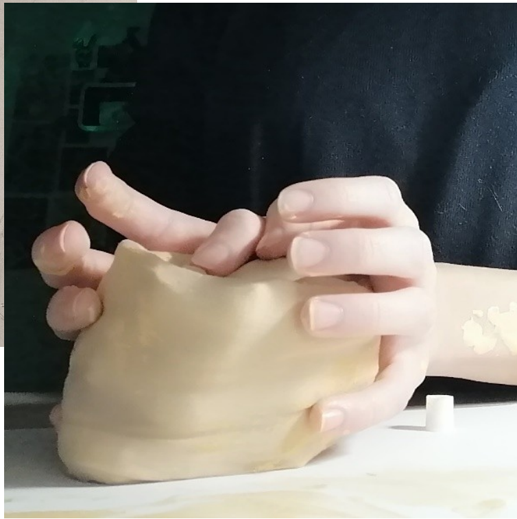
Oblikovanje glinene posode