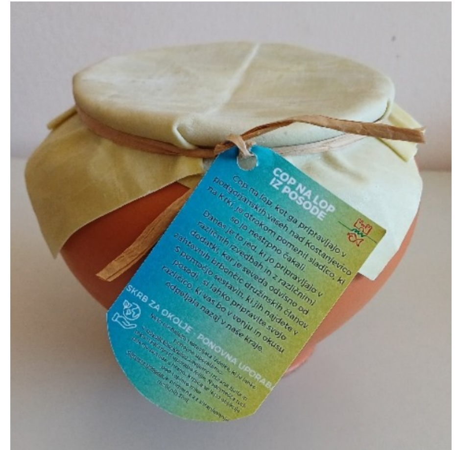
Turistični produkt: Cop na lop iz posode