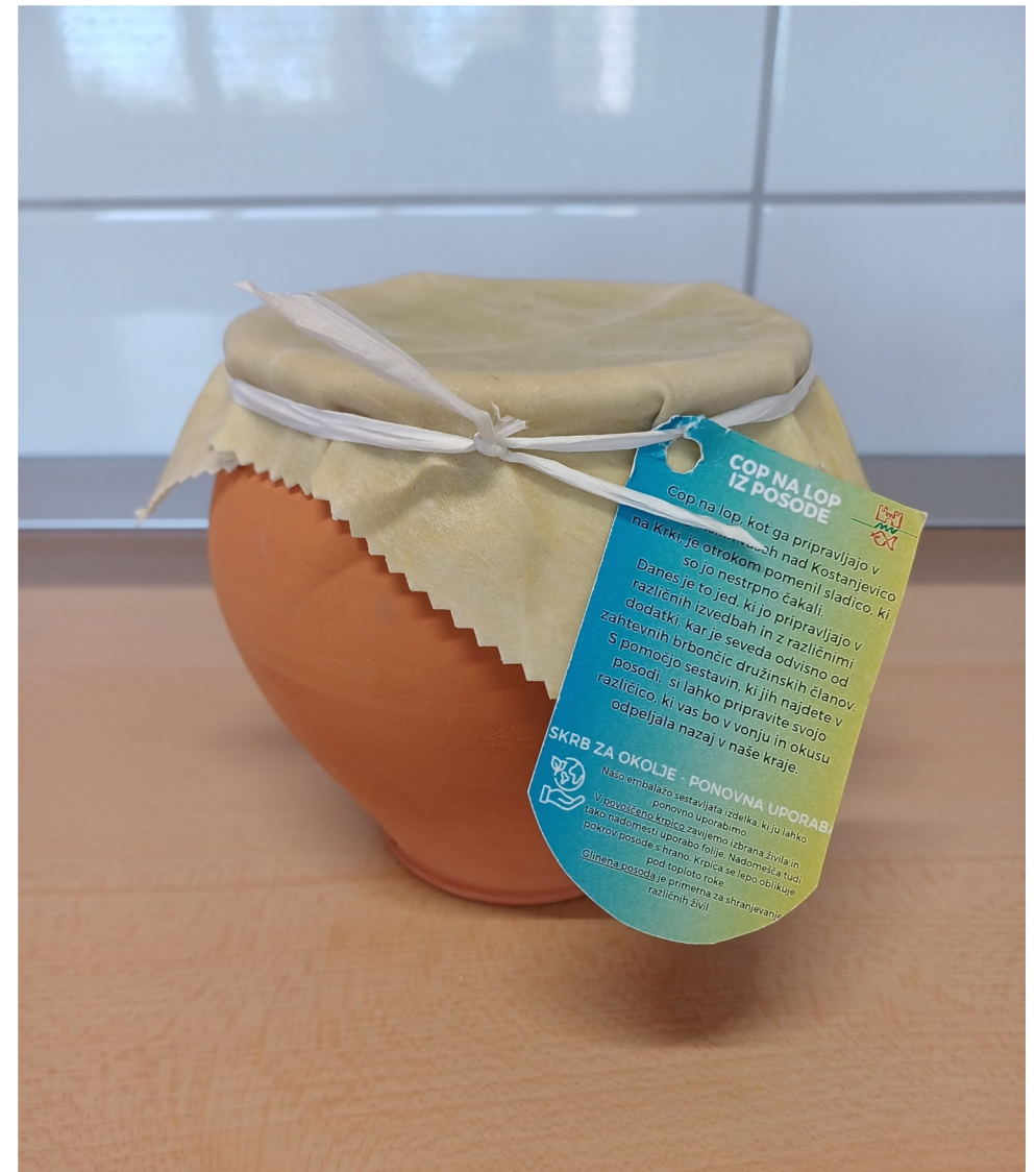
Turistični produkt: Cop na lop iz posode