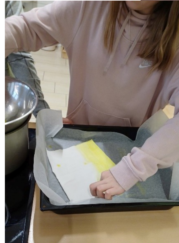
Izdelovanje pivoščnih krpic