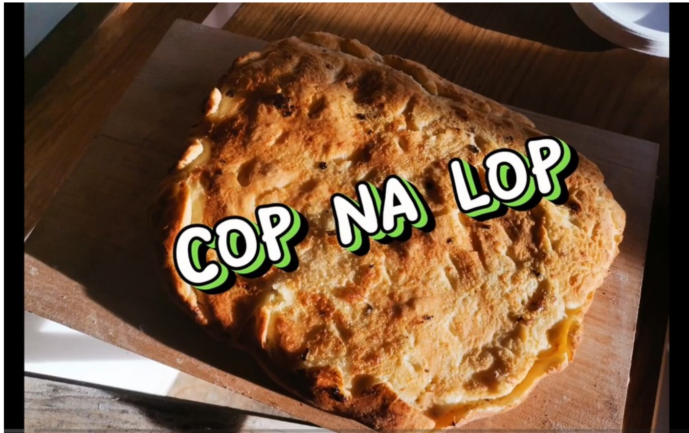
Zajem zaslona: Cop na lop