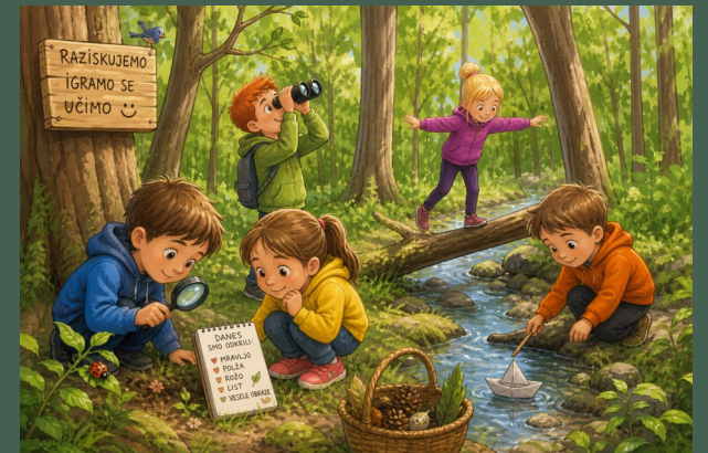
Slika 1: Ustvarjena z UI.