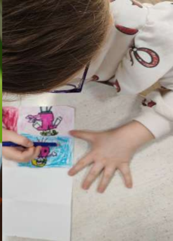
Izrada parnih slika prema likovima iz slikovnica